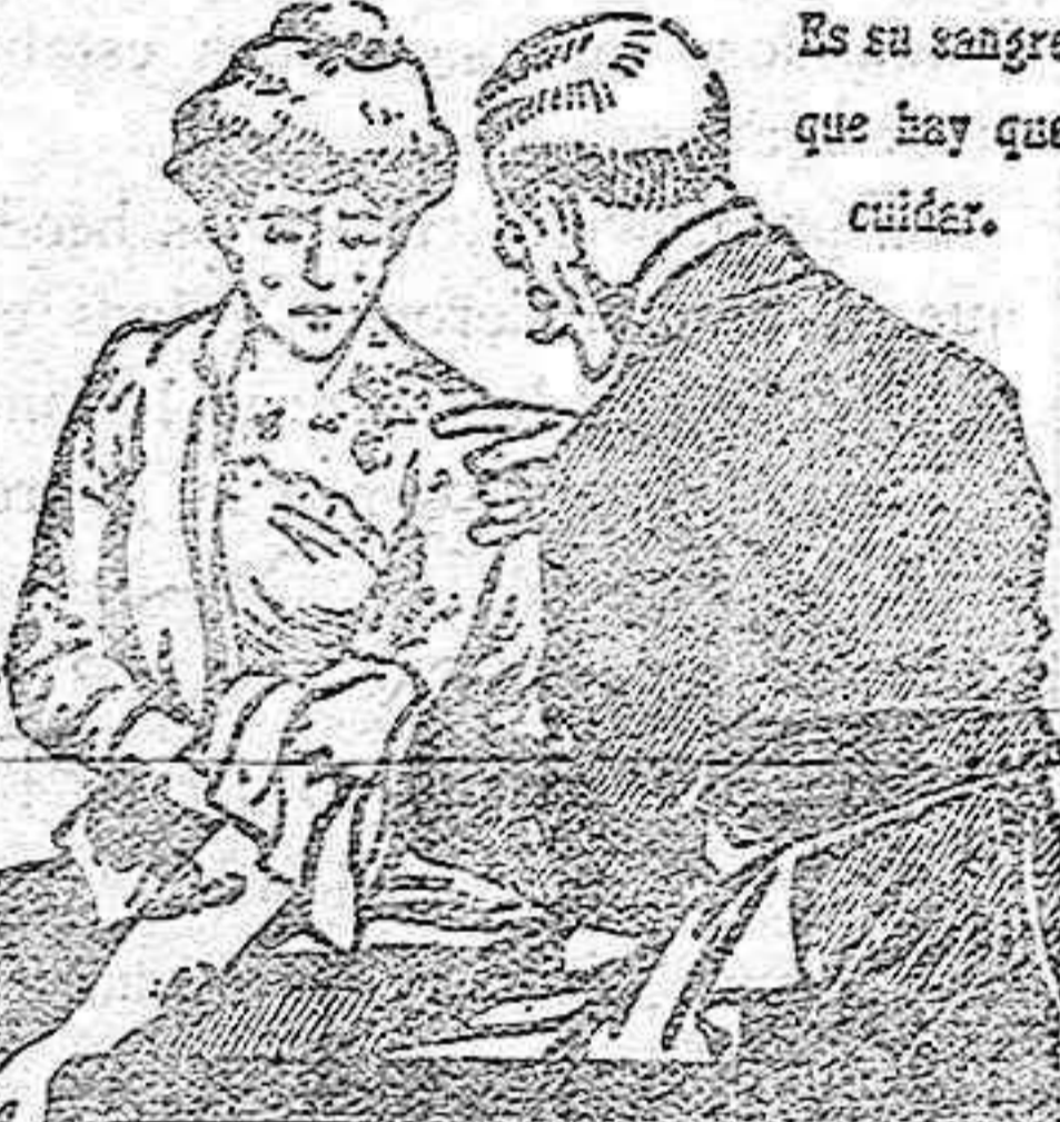
Es su sangre que hay que cuidar.