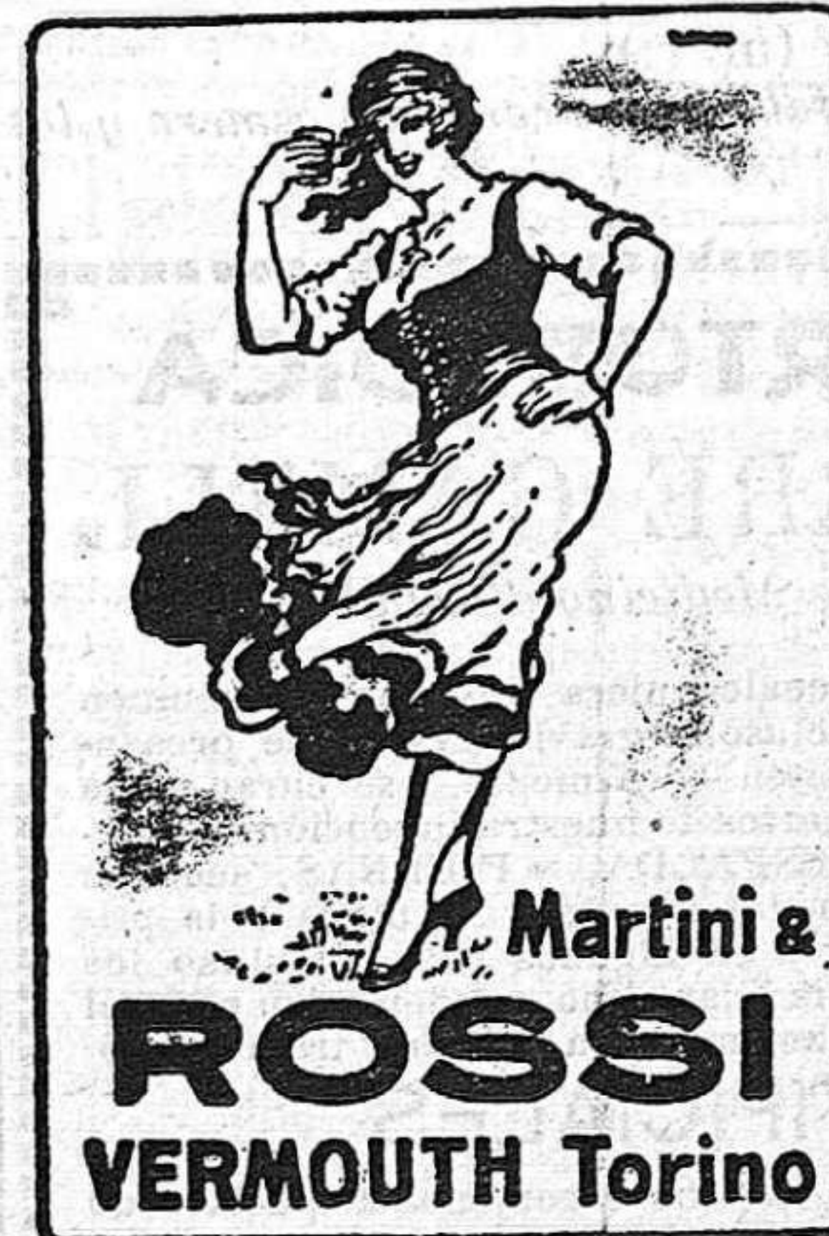
De venta en el Circulo Mercantil.

PIDA USTED SIEMPRE COGNAC V V V Idem EXTRA Idem V. O. G. VINO VIÑA PEMARTIN SOLERA PEMARTIN Jerez de la Frontera. Venta en todos los Establecimientos.