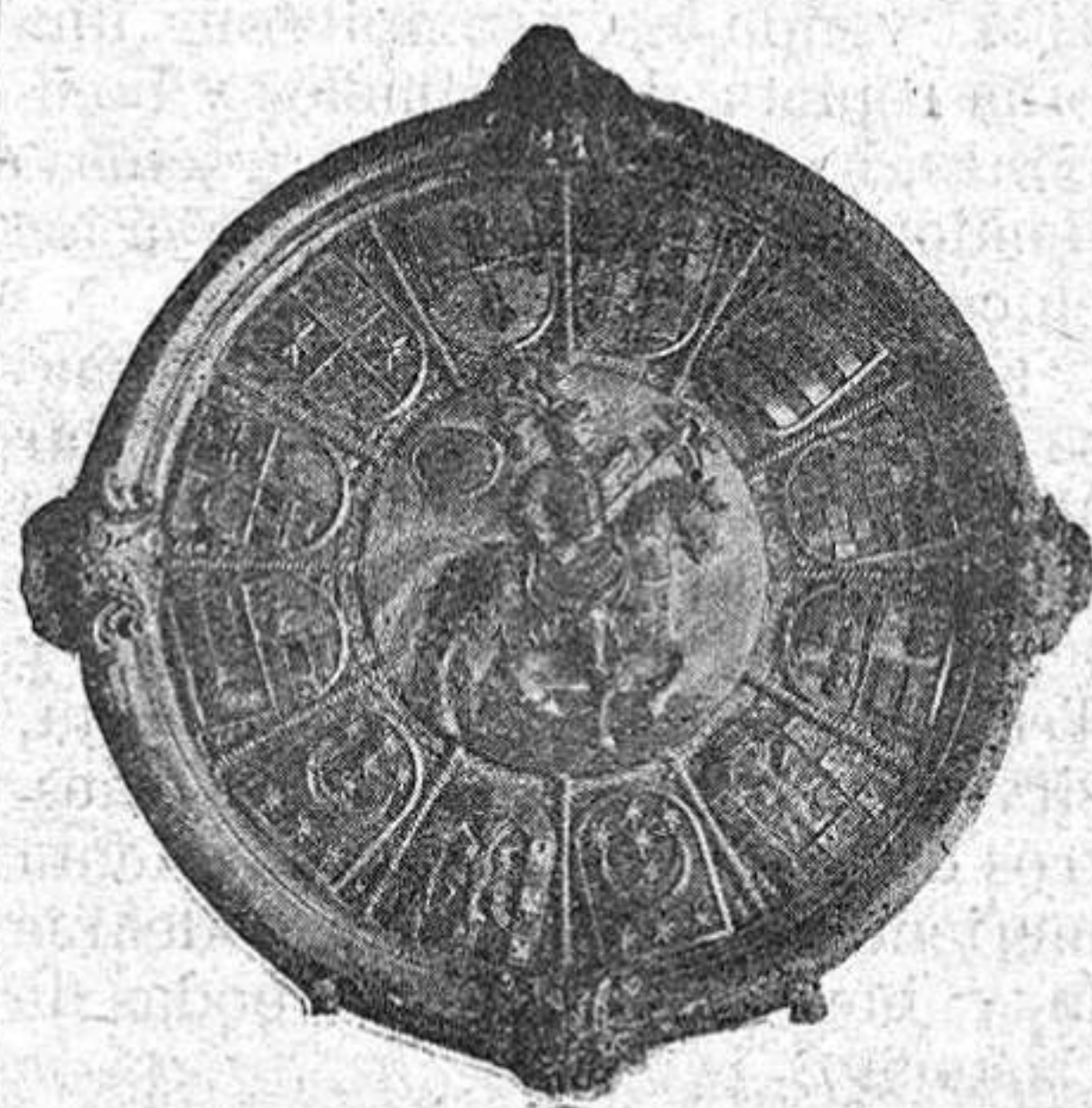
Magnífica Rueda de los Linajes conservada en la Diputación.

parte, en 1304, el Emplazado concedió á los caballeros y concejo de Soria la señalada y honrosa merced de ser ellos los encargados de guardar al Rey y á sus hijos herederos, cuando saliesen en hueste, como ya lo venían haciendo en anteriores tiempos, acaso desde los días del magnánimo Alfonso VIII. Alrededor de la antigua iglesia románica de San Lázaro, cuyas carcomidas ruinas subsisten aún al otro lado del puente, frente al monte de Las Animas, idealizado por Bécquer, poseían los Linajes varias tierras de labor; con cuyas rentas, las de la Cruceja y la Tablada y los dos tercios de la desunta de Valonsalero, fundaron y sostenían el llamado hospital de Sancti Spiritus, donde se recogía y criaba á los infelices niños abandonados.