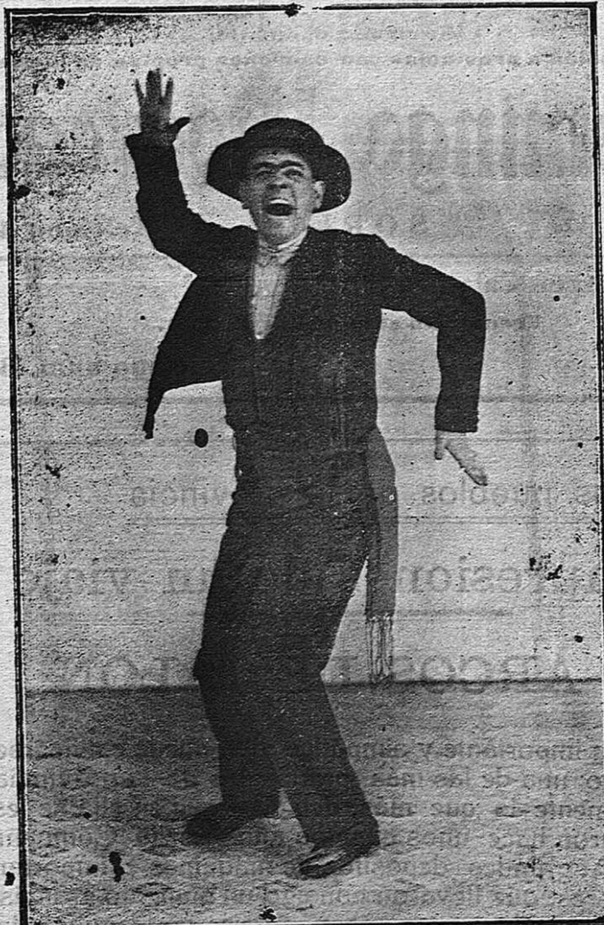
JOSE LINARES, verdadero fenómeno del baile flamenco cómico-serio-parodista

Estos cuatro artistas, están calificados como los mejores en su clase, y lo demuestran los premios alcanzados en concursos en los que tomaban parte los más famosos cantadores de flamenco y los más aplaudidos guitarristas de este género, y si a ellos se une José Linares, que viene precedido