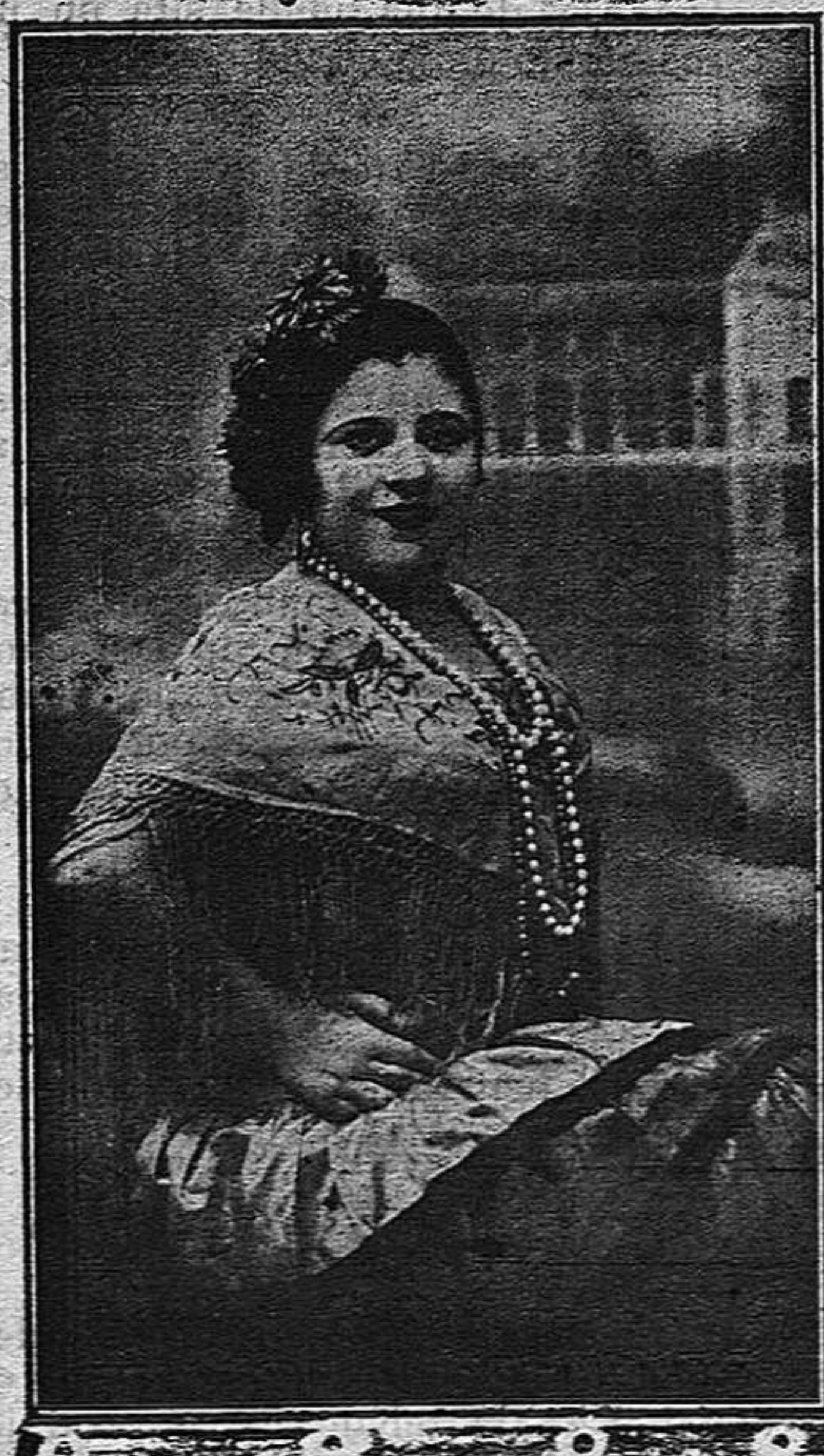
AFRICANITA, colosal cancionista de género andaluz