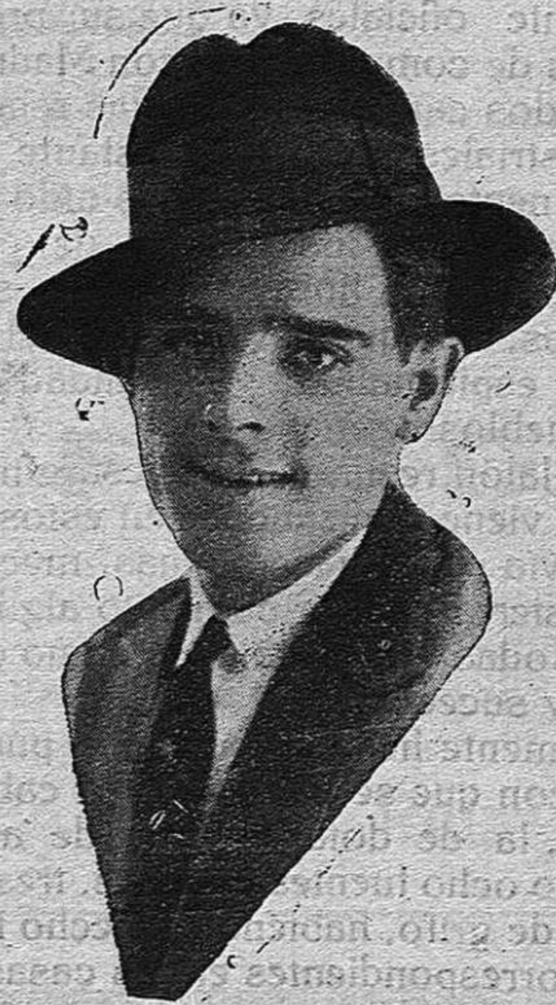
Niño Vélez-Málaga, llamado con justicia el revolucionario del Cante andaluz.