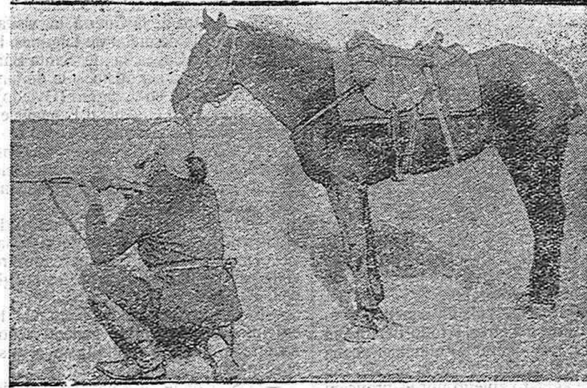
UN SOLDADO DE DRAGONES FRANCESES SORPRENDIDO POR LOS ALEMANES DEFENDIÉNDOSE.

sitán, ya que en algunos puntos hasta el agua es preciso llevarla de España.