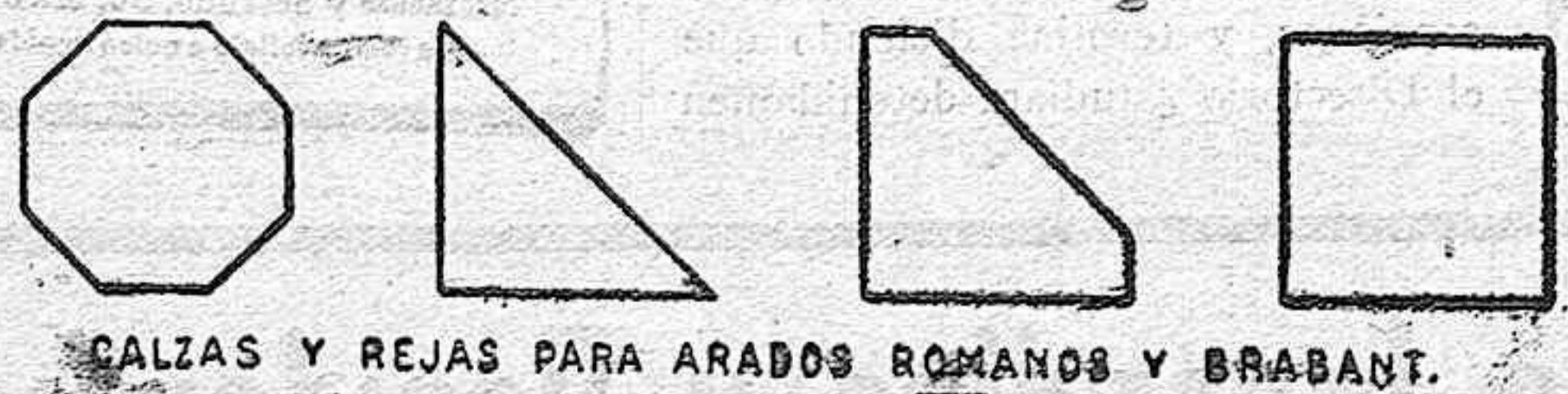
CALZAS Y REJAS PARA ARADOS ROMANOS Y BRABANT.