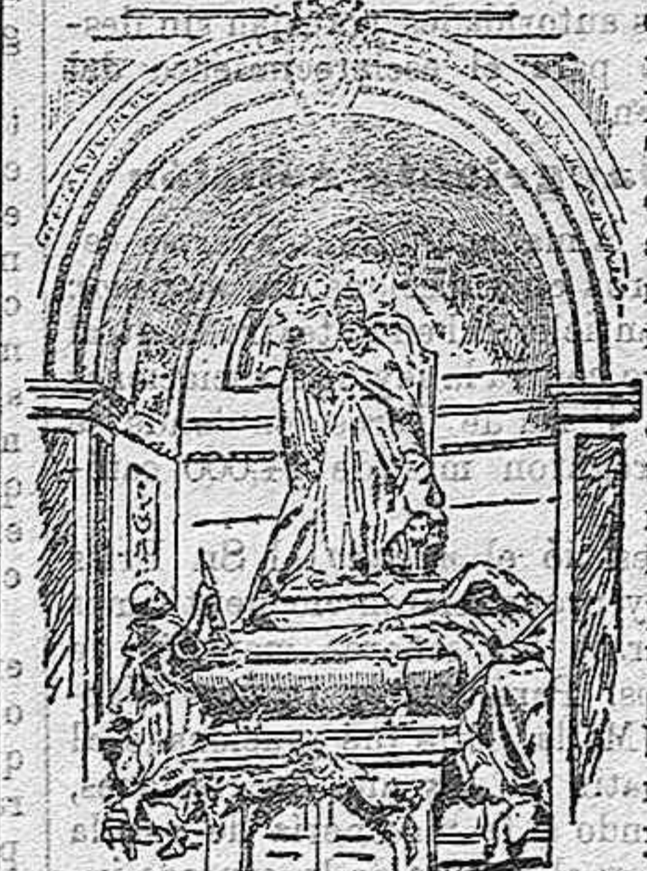
SEPULCRO DEFINITIVO DE LEÓN XIII EN LA BASÍLICA LATERANENSE.