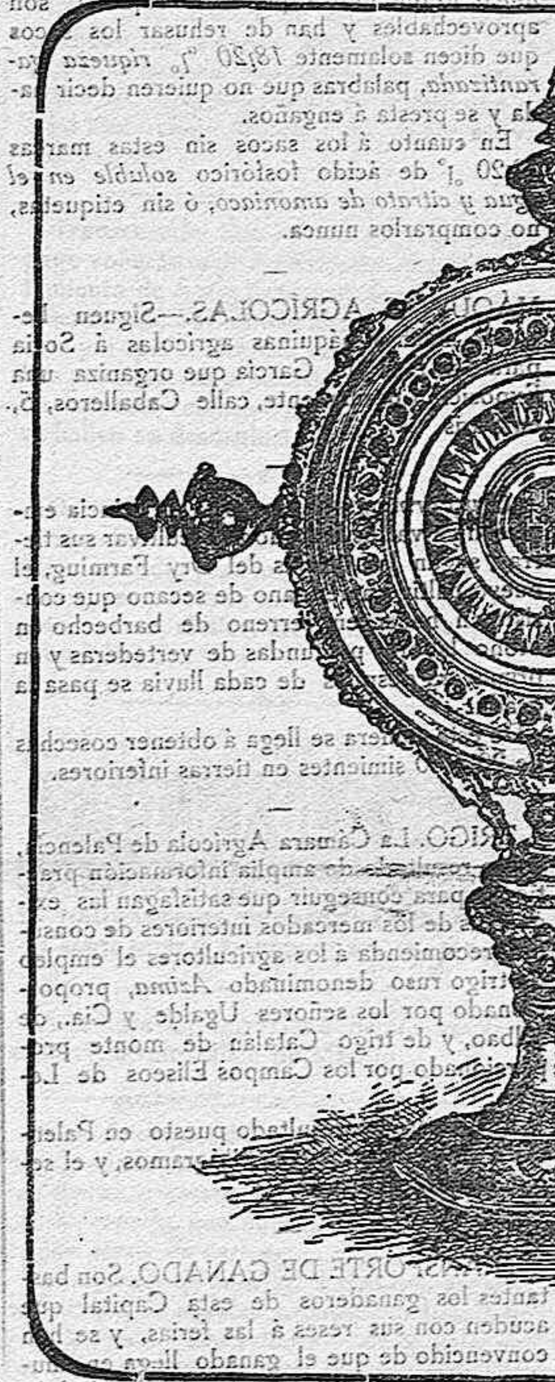
EL LIGNUM CRUCIS DE LA COLEGIATA