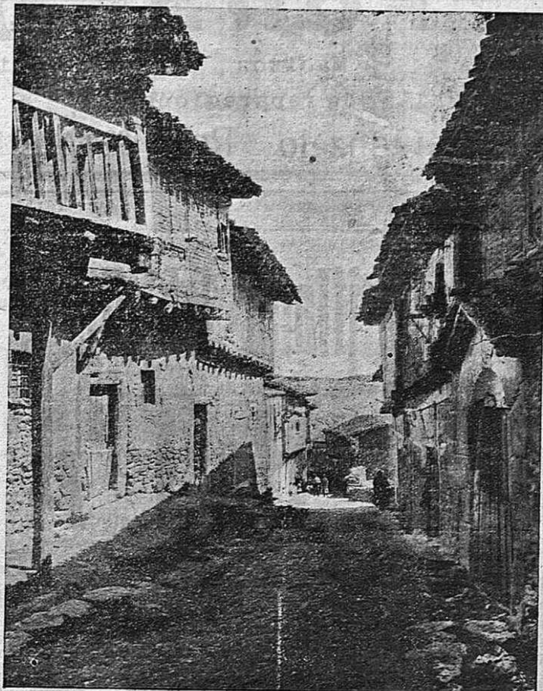
Una bella vista del pueblo de Calatañazor

Se halla completamente mejorado de la enfermedad que le retuvo en cama varios días, nuestro buen amigo el joven juez municipal de Soria don Valentín Ropero.