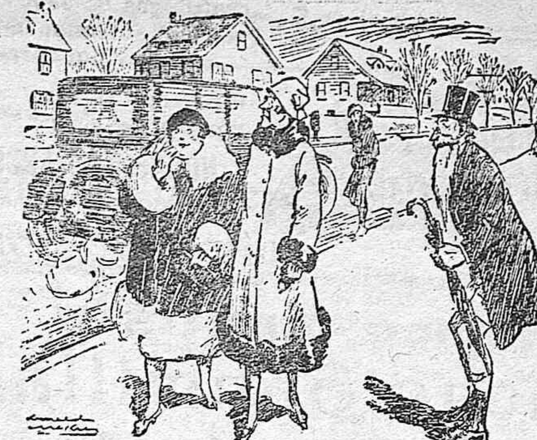
EL SABIO DISTRAIDO —Qué situación más graciosa... Todos pretenden que yo soy un distraído y he aquí mi propia mujer que no me reconoce en la calle. (De «Judge»)