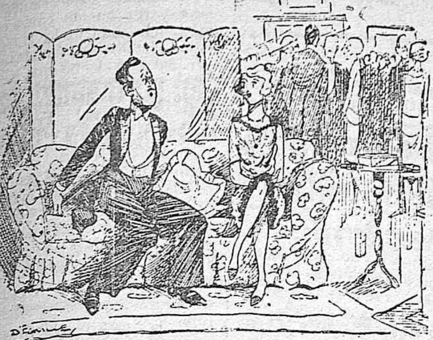
—He metido la pata. He dicho a un señor que la comida no podía ser más mala... y resulta que es el amo de la casa. —Es decir, que ha estado usted hablando con mi marido... (De «London Opinion»)