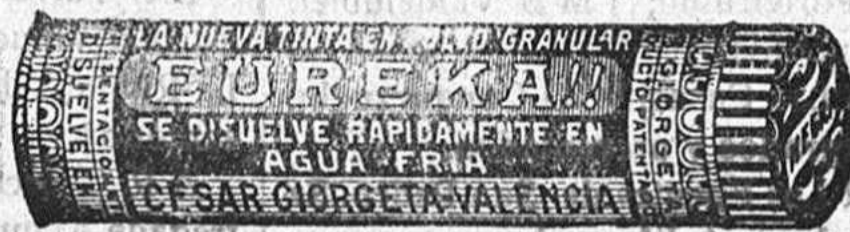
Librería de "SANTA TERESA"

Acompañando su importe en Sellos de correo o por Giro Postal.