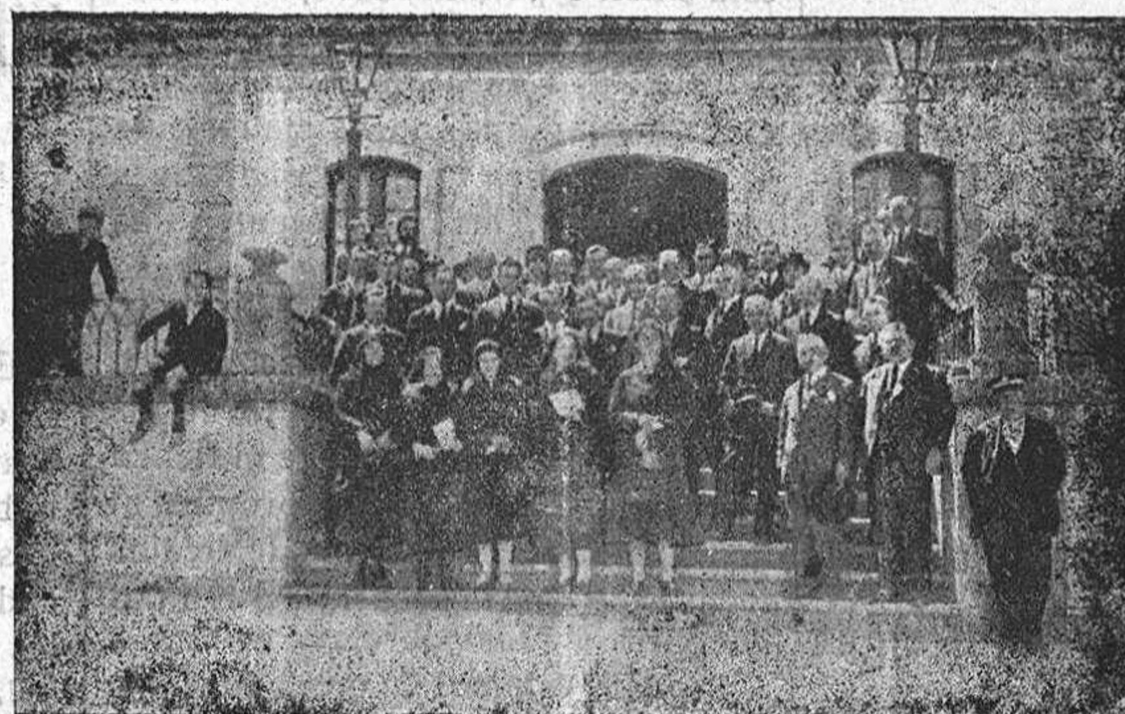
Grupo de autoridades y maestros al salir de la sesión inaugural de la Semana Social.