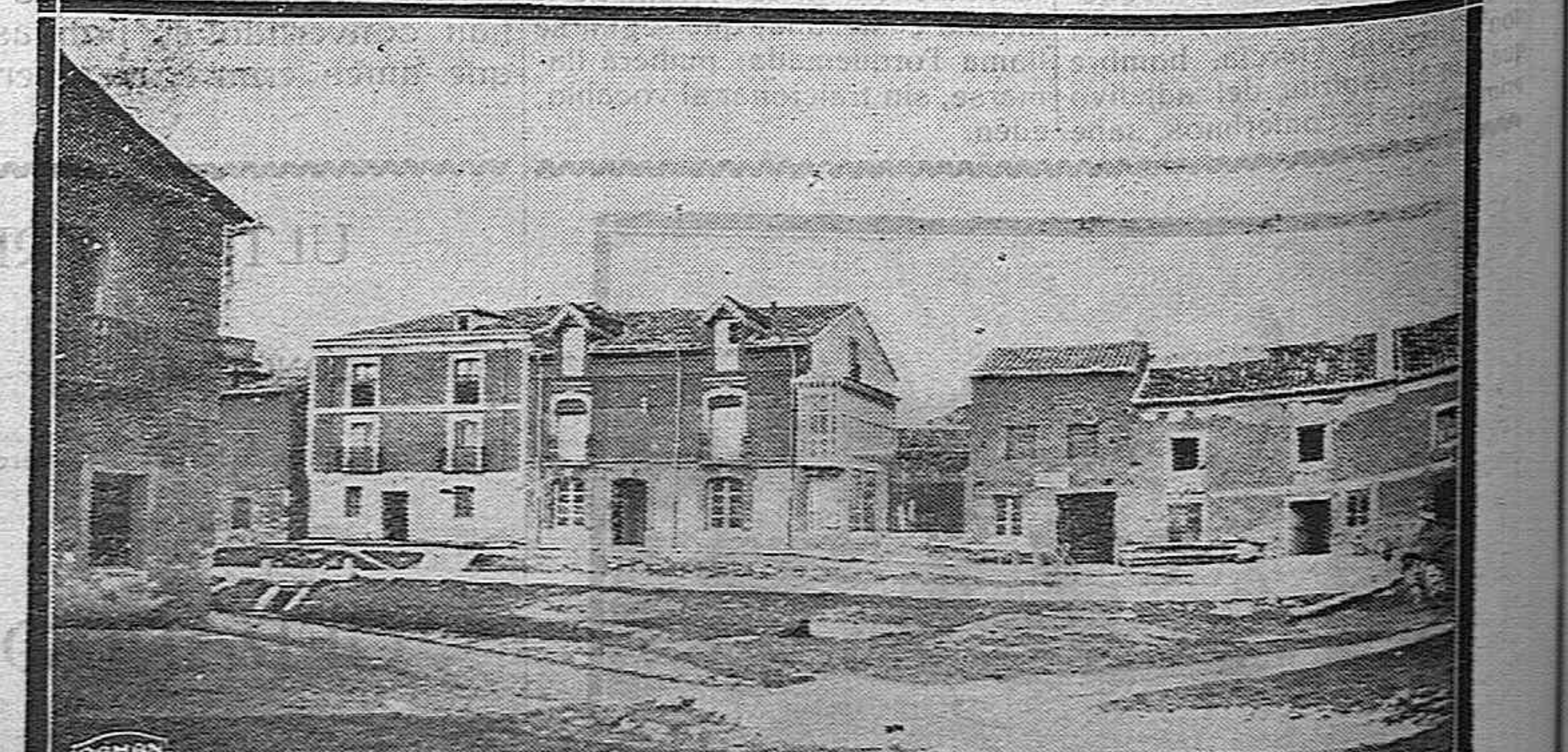
Aspecto de una calle Torquemadina.