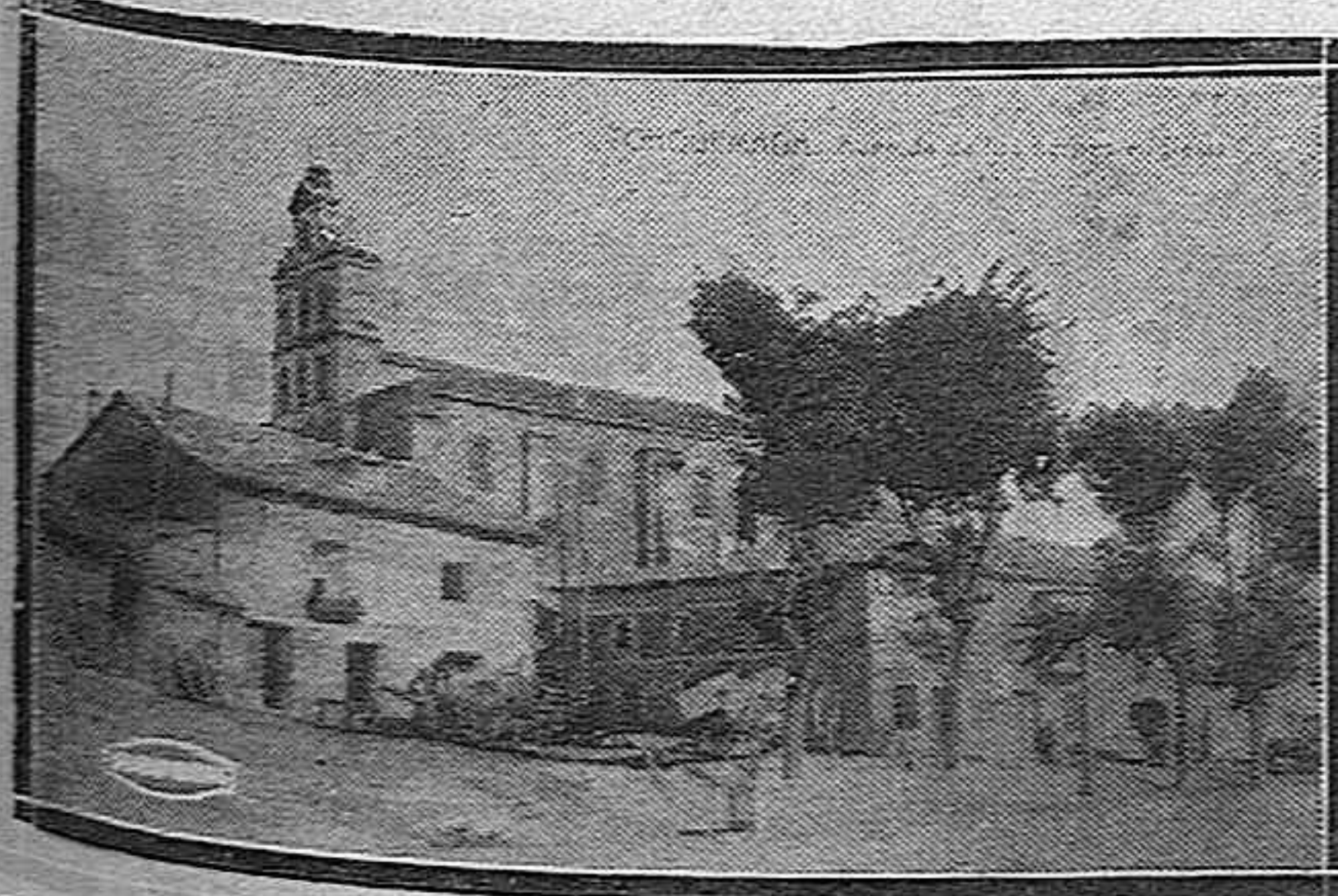
Una vista de la Iglesia y avenida de los héroes.