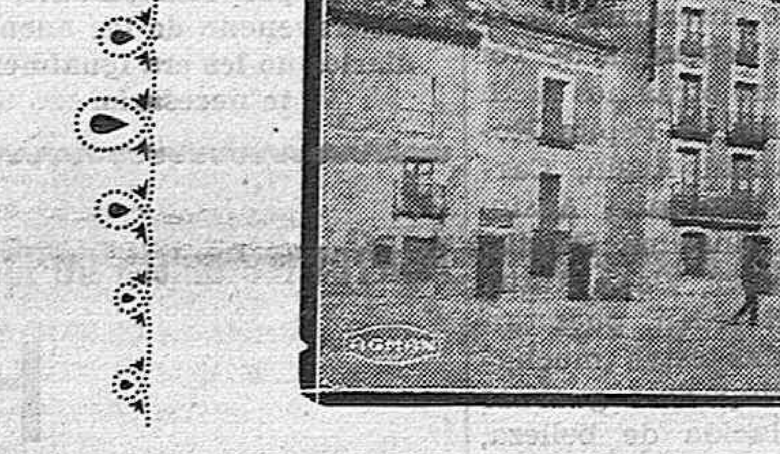
Plaza y casa Consistorial.—(Foto Albino R. Alonso)

parece sonreír la voluta de humo escapada de nuestro cigarro mientras don Silvano en presencia del señor alcalde—otro inmejorable señor—va dándonos cuenta del bienestar del Municipio.