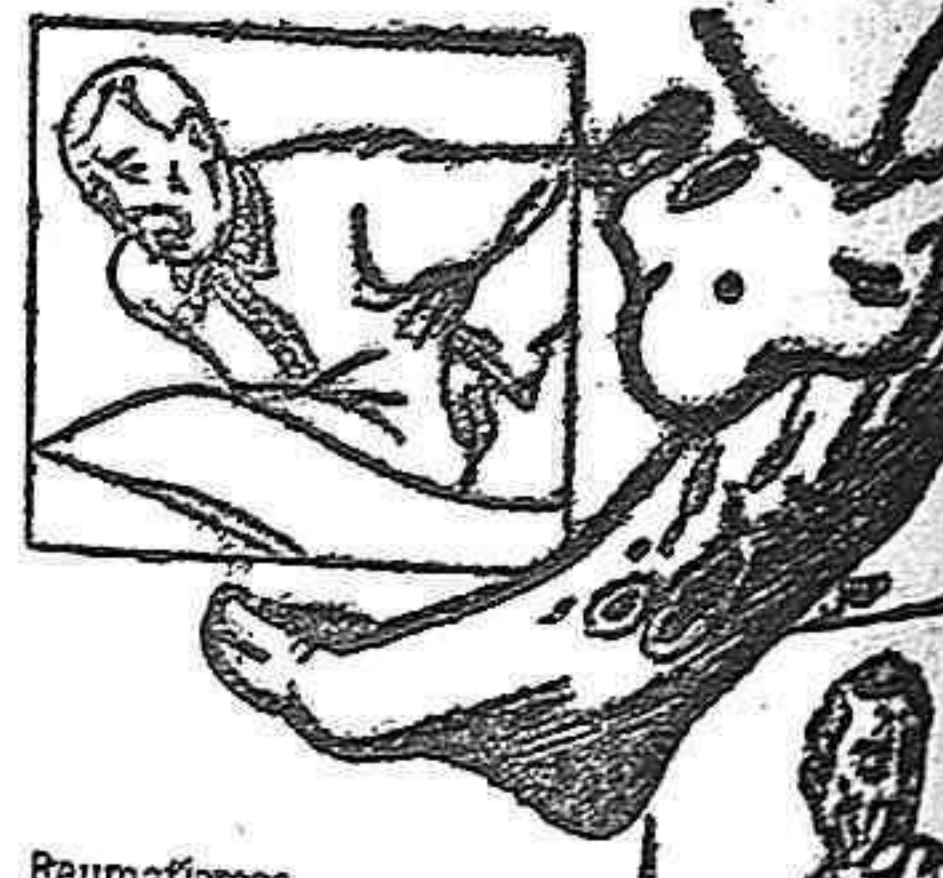
Reumatismas Enfermedades de las pleuras Enfermedades de la piel Arterio-esclerosis

Enfermedades del ganado vacuno, lanar, cabrio, de cerda y demás animales domésticos. Vacunación antirrábica en el perro. Cojeras, hembras ortopédico, etc., etc. Calle de Burgos próximo a la Iglesia de San Lázaro Palencia.