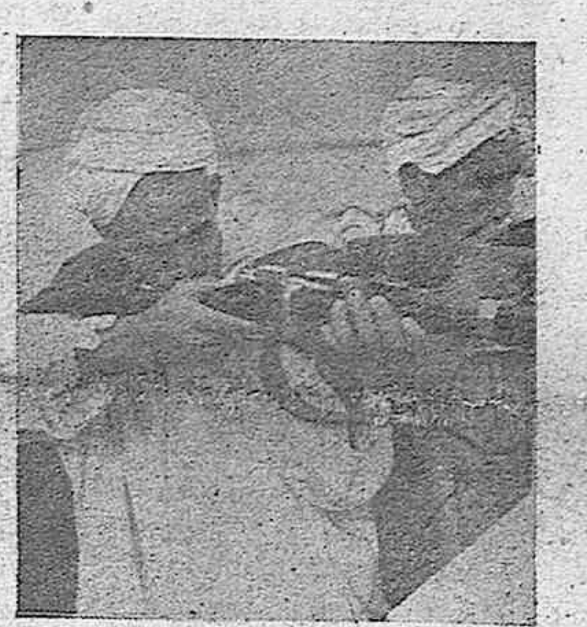
Un grupo de árabes practicando en una demostración de tiro.

El Comité inter-departamental que organiza el viaje se halla muy ocupado revisando los proyectos hechos y anunciará los nuevos planes realizados tan pronto como se conozca más decididamente en qué momento el «Empresa de Australia» llegará a Quebec.—LOGOS.