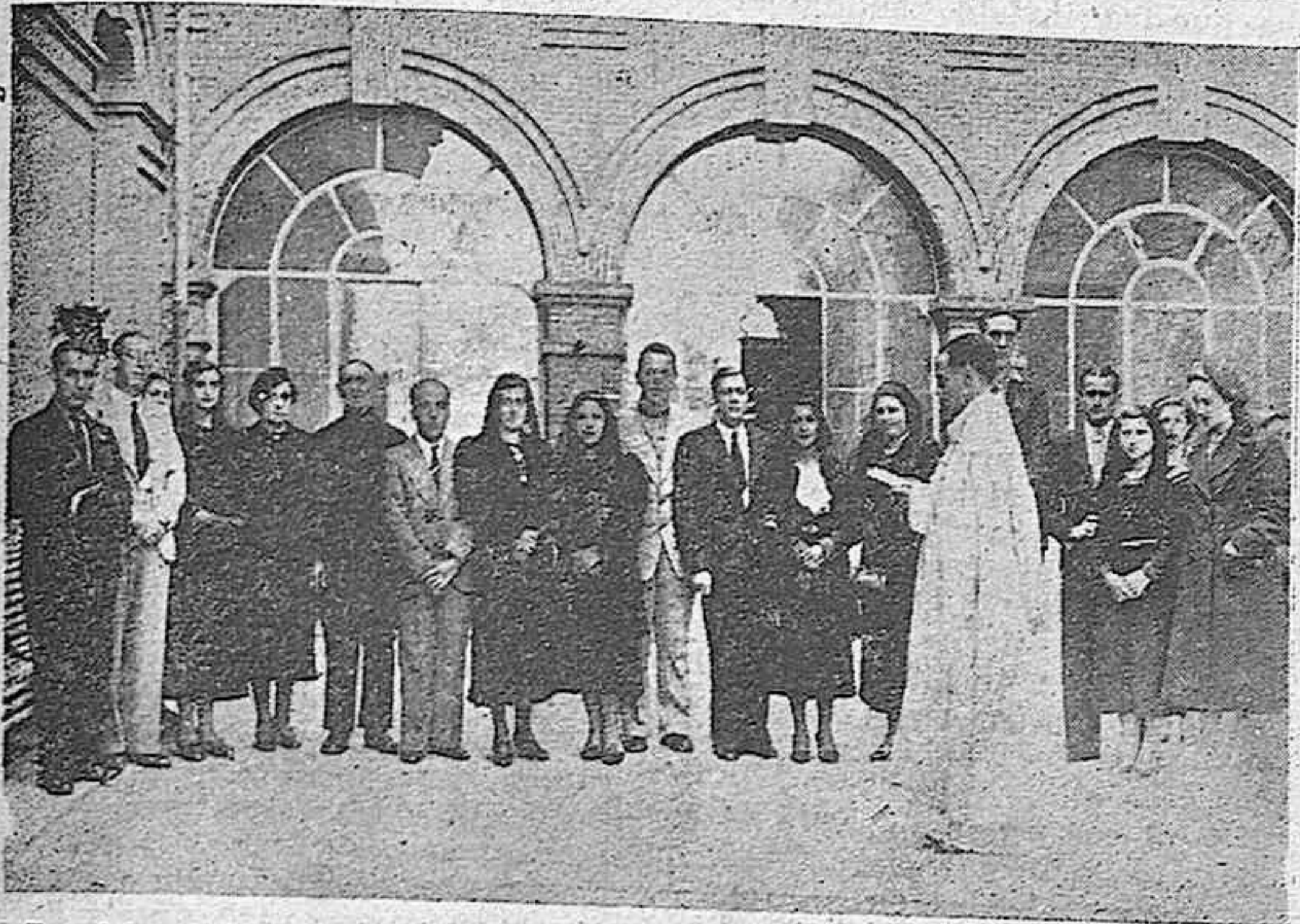
En el local de Frentes y Hospitales de Salamanca, Palencia y Valladolid en Madrid, ha tenido lugar el acto solemne de dar validez canónica a cuatro matrimonios civiles, contraídos en tiempos de la dominación roja. He aquí los cuatro matrimonios con algunos amigos y elementos de Frentes y Hospitales.

Matrimonios colectivos en Frentes y Hospitales de Palencia en Madrid