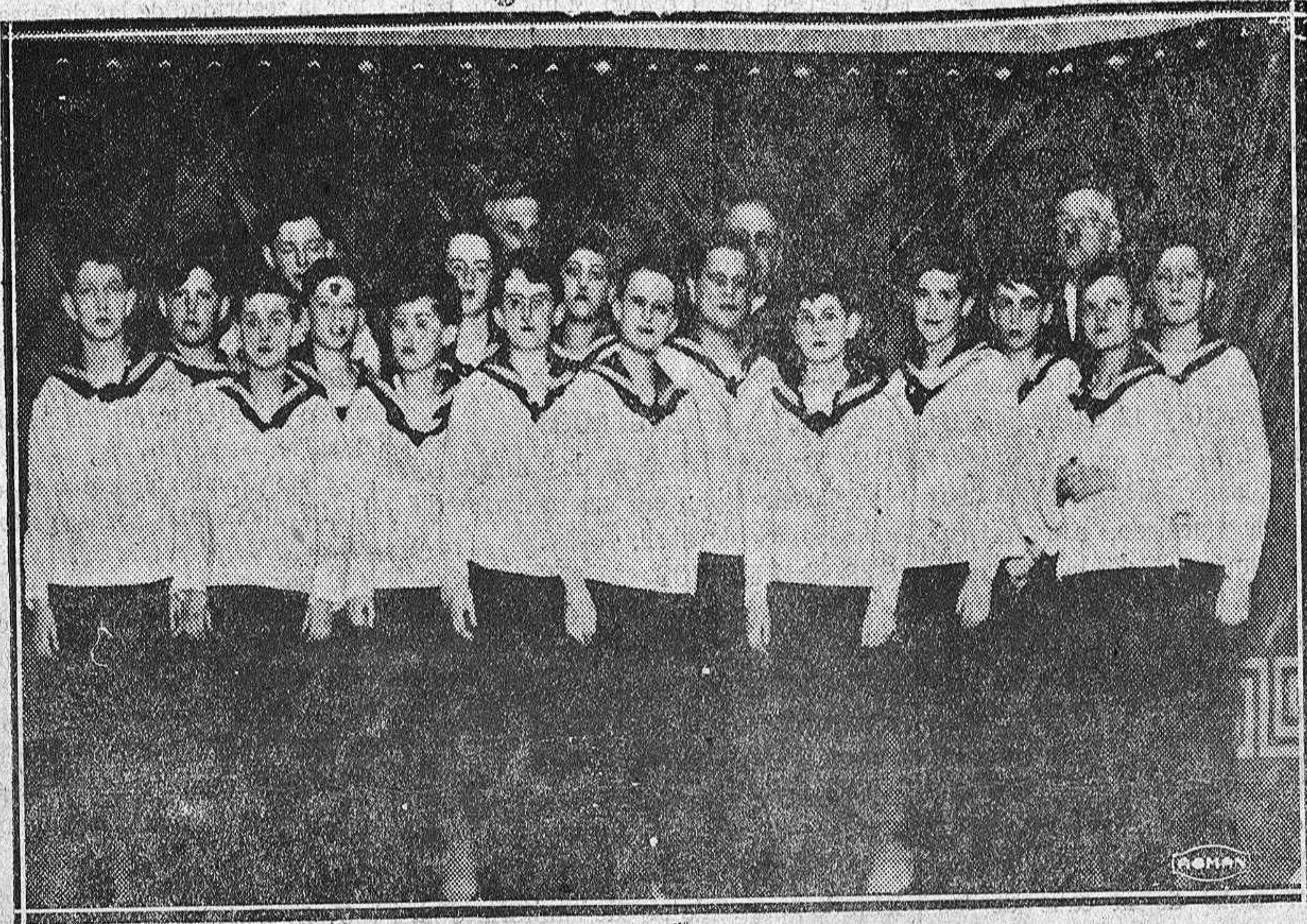
Coro de niños de la Capilla Real de Viena, que actuó en el Concierto de la Filarmónica