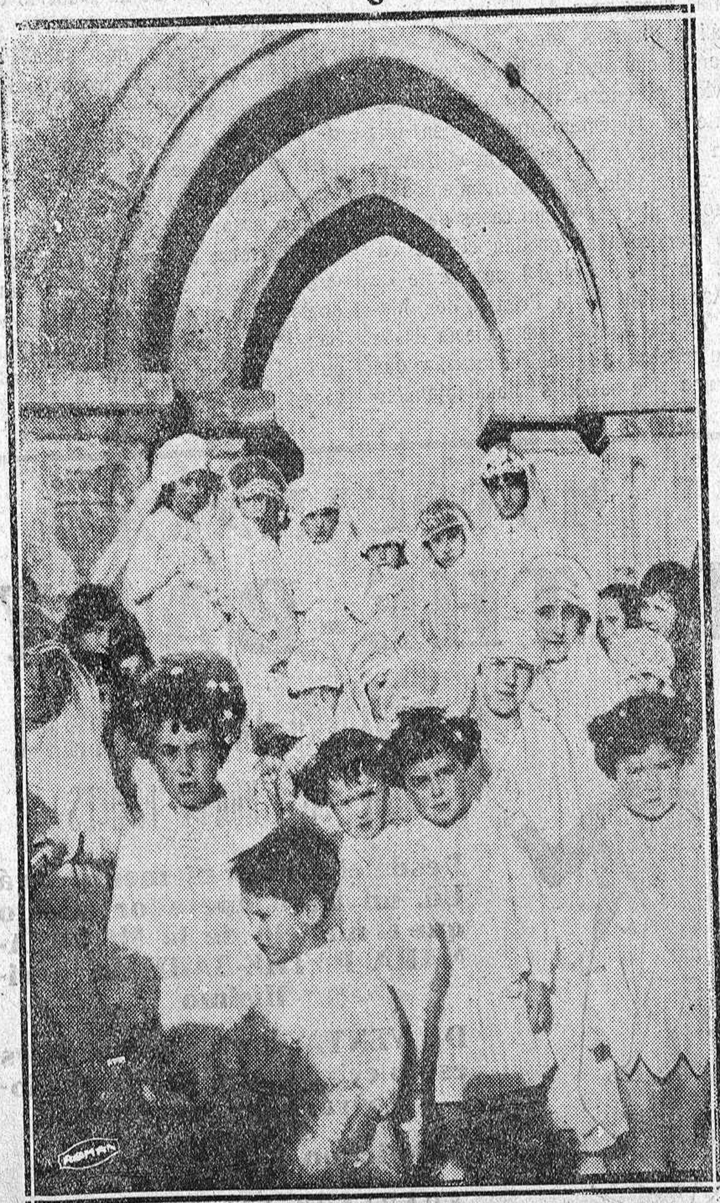
Ramillete de preciosas niñas que recibieron por primera vez el Pan de los ángeles, en San Lázaro