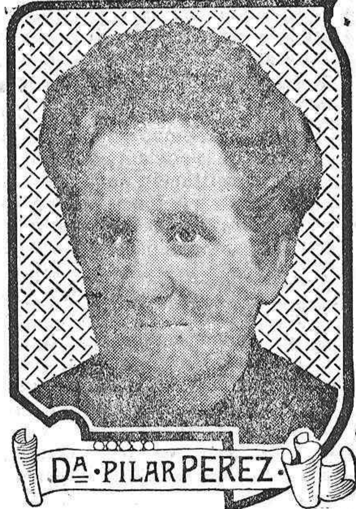
DA PILAR PEREZ

¿También podrán curarme a mí las píldoras Pink? Tal es la pregunta que muchos enfermos se hacen a sí mismos cuando oyen referir alguna de las numerosas curaciones debidas a ese incomparable regenerador de la sangre, las Píldoras Pink. Si discurren con un poco de lógica comprenderán estos enfermos que no hay razón alguna para que las Píldoras Pink hayan curado al vecino, que padecía de le misma enfermedad que ellos, y no hayan de curarlos a ellos mismos. Si se deciden a tomar las Píldoras Pink verán por experiencia que han discurrido con acierto.