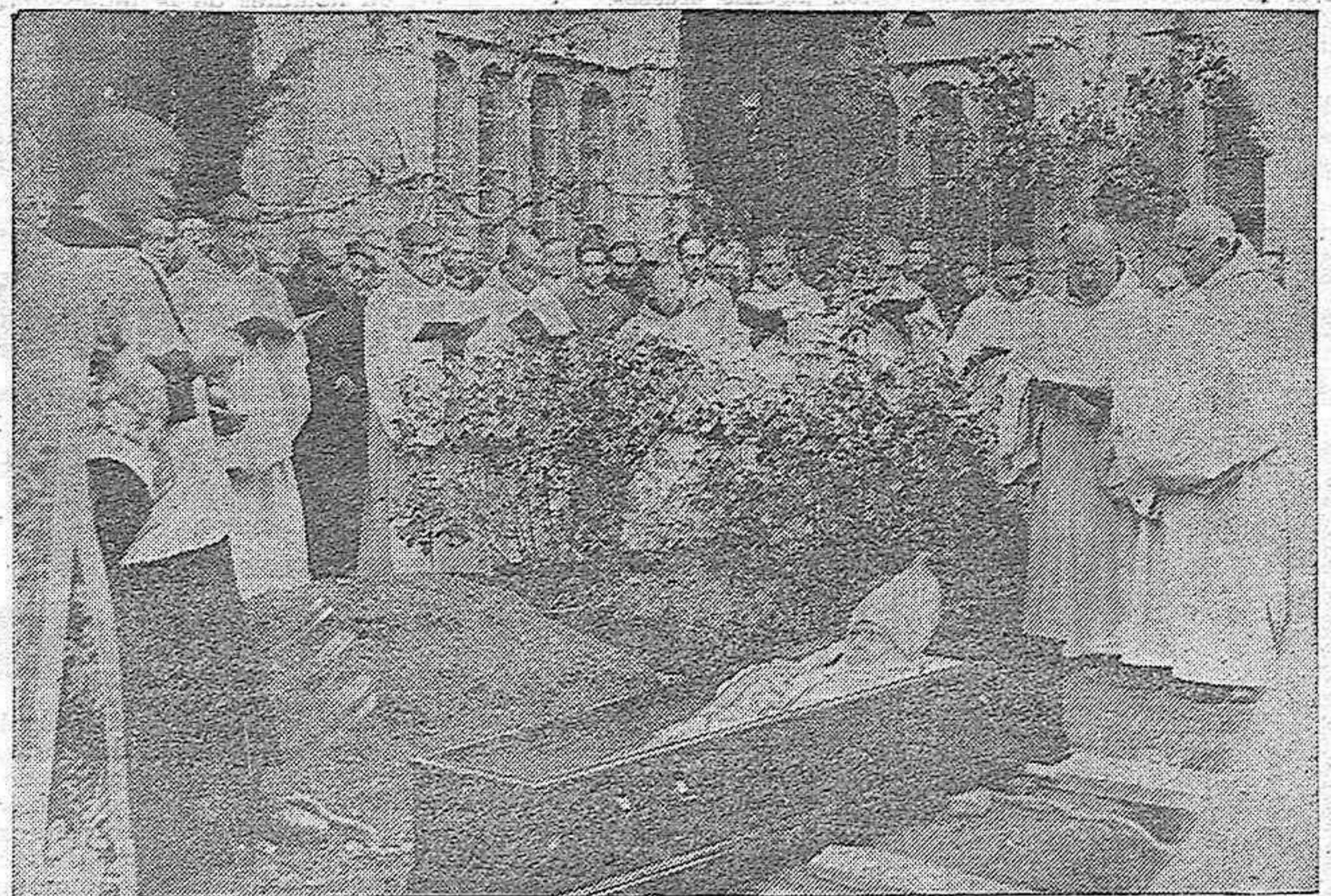
El cadáver de Fray María Félix Alonso al lado de la que iba a ser su tumba, en el cementerio del Convento Cisterciense de San Isidro de Dueñas, momentos antes de ser enterrado. La Comunidad entona cánticos litúrgicos y respuestas por el finado.