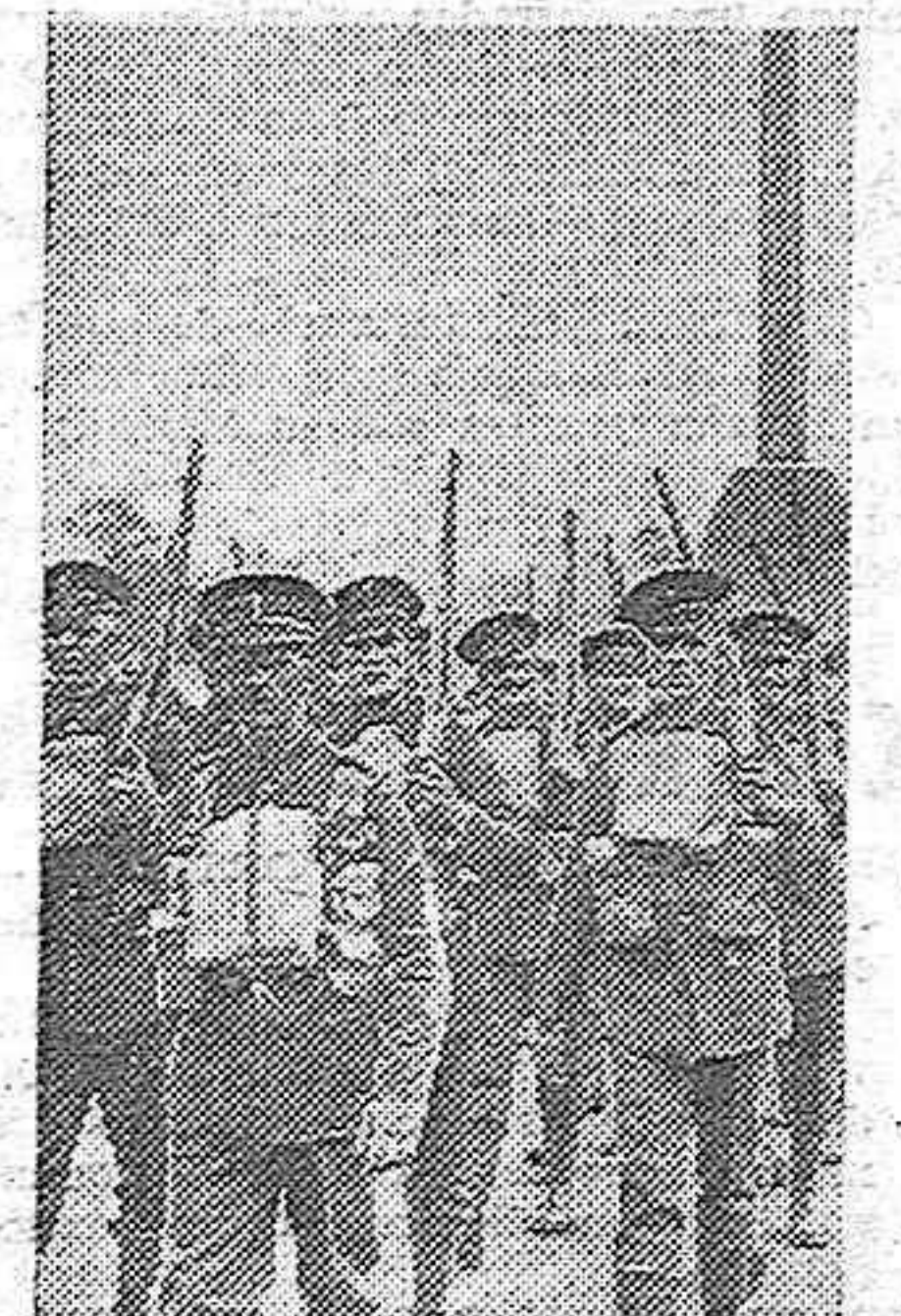
Los soldados ingleses llegados a París desfilan por la plaza de la Concordia.