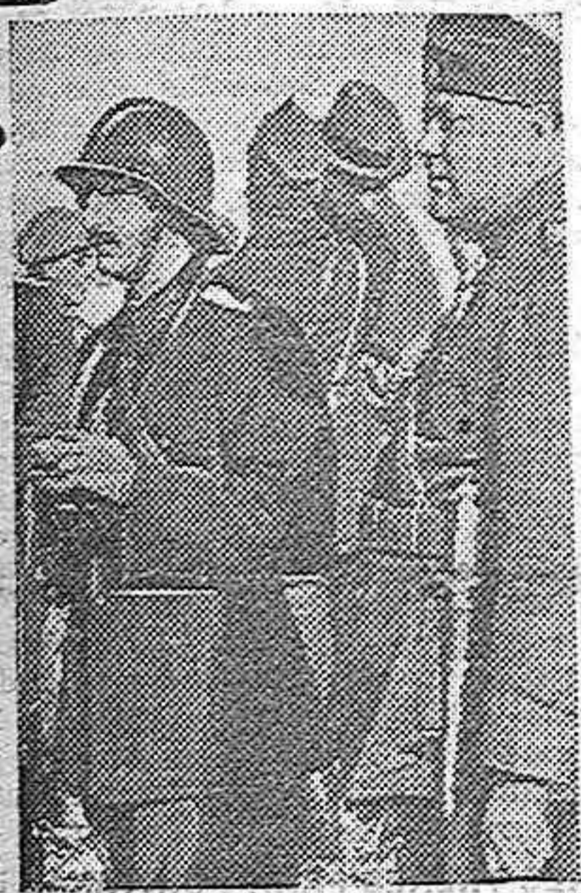
El Rey Boris de Bulgaria y el primer ministro, Kjosseivanof, inspeccionan las tropas concentradas en las fronteras.