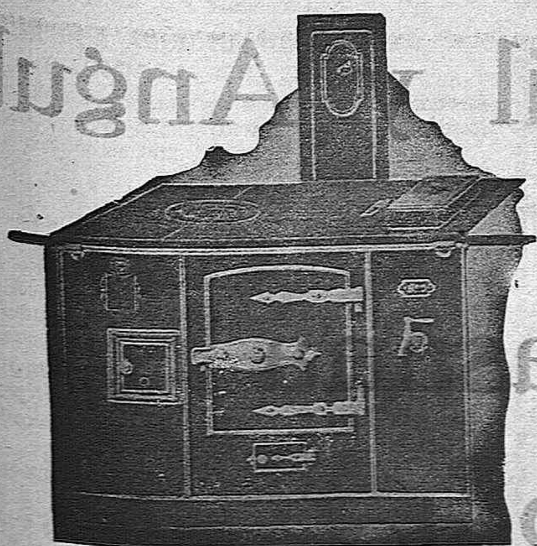
La Cocina "ABANDO" no tiene rival Puede adquirirla en los almacenes de ferretería de