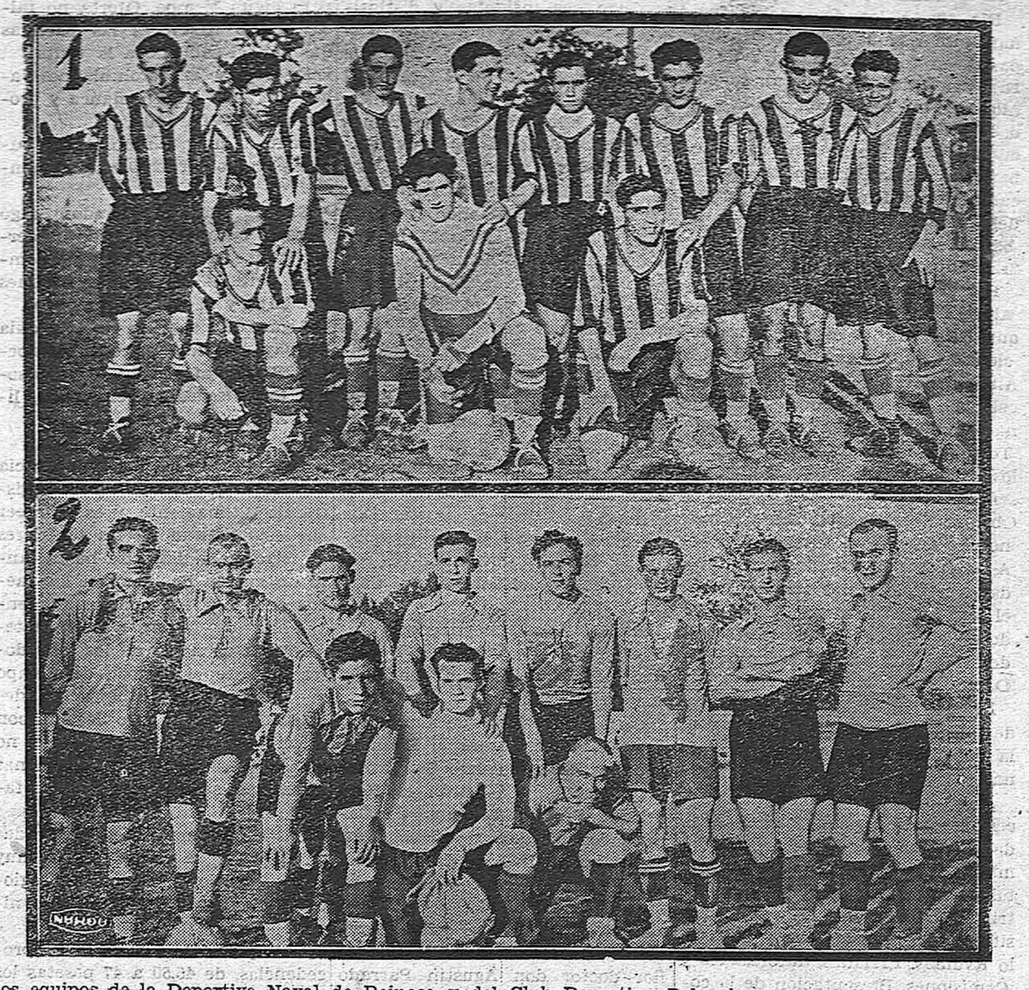
Los equipos de la Deportiva Naval de Reinoso y del Club Deportivo Palencia, que empataron el domingo pasado.