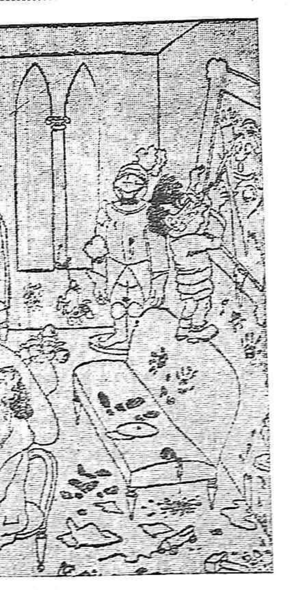
EL MOZO.—¡Eh, caballero! Este departamento está reservado para un príncipe. EL DEL PURO.—¿Y cómo diablos ha averiguado usted que yo soy el Príncipe?

Mañana domingo, 7 de septiembre de 1930 GRANDIOSA FUNCION DE DESPEDIDA por la compañía del GRAN CIRCO FEIJOO A PRECIOS POPULARES