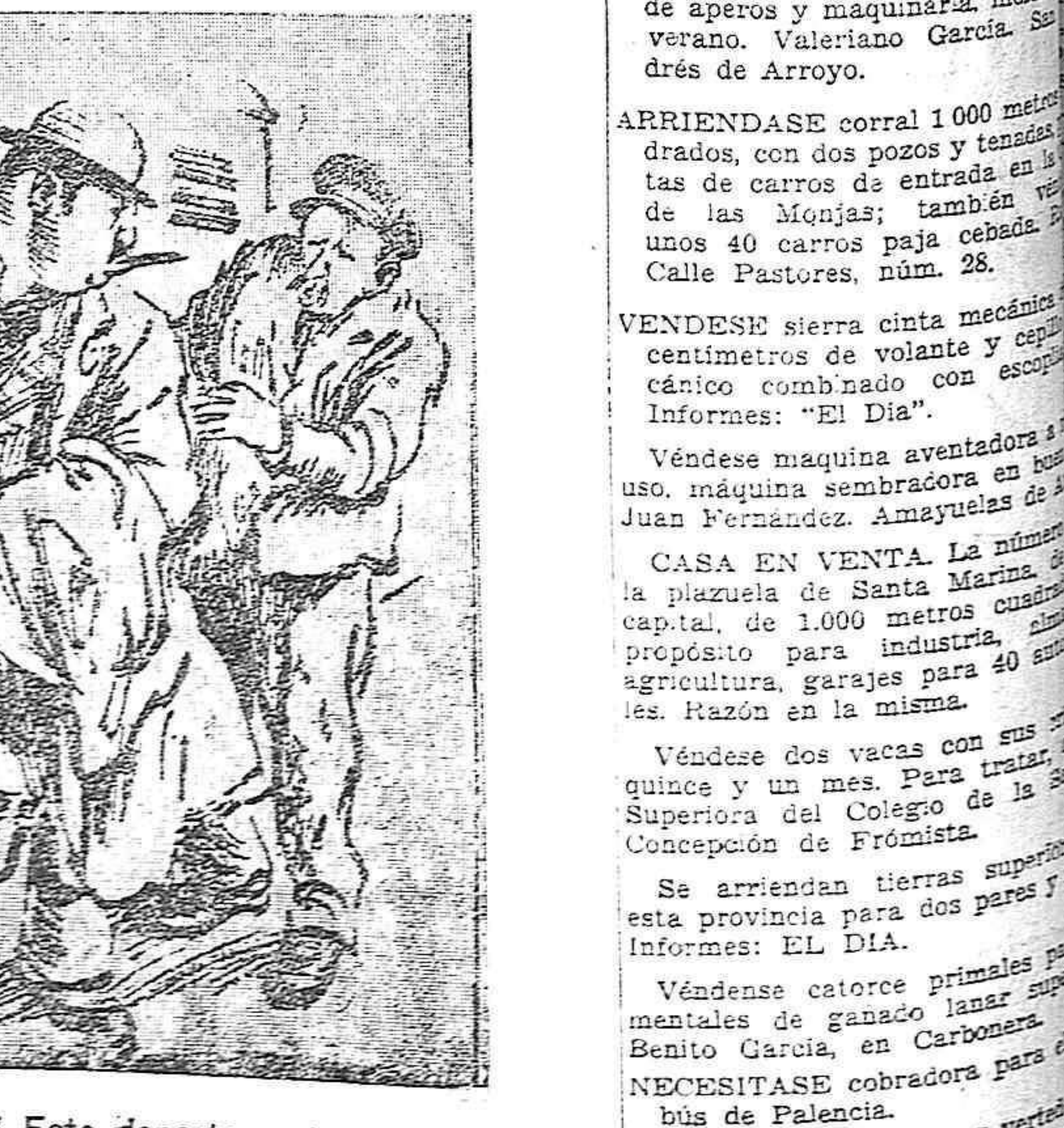
EL MOZO.—¡Eh, caballero! Este departamento está reservado para un príncipe. EL DEL PURO.—¿Y cómo diablos ha averiguado usted que yo soy el Príncipe?

Mañana domingo, 7 de septiembre de 1930 GRANDIOSA FUNCION DE DESPEDIDA por la compañía del GRAN CIRCO FEIJOO A PRECIOS POPULARES