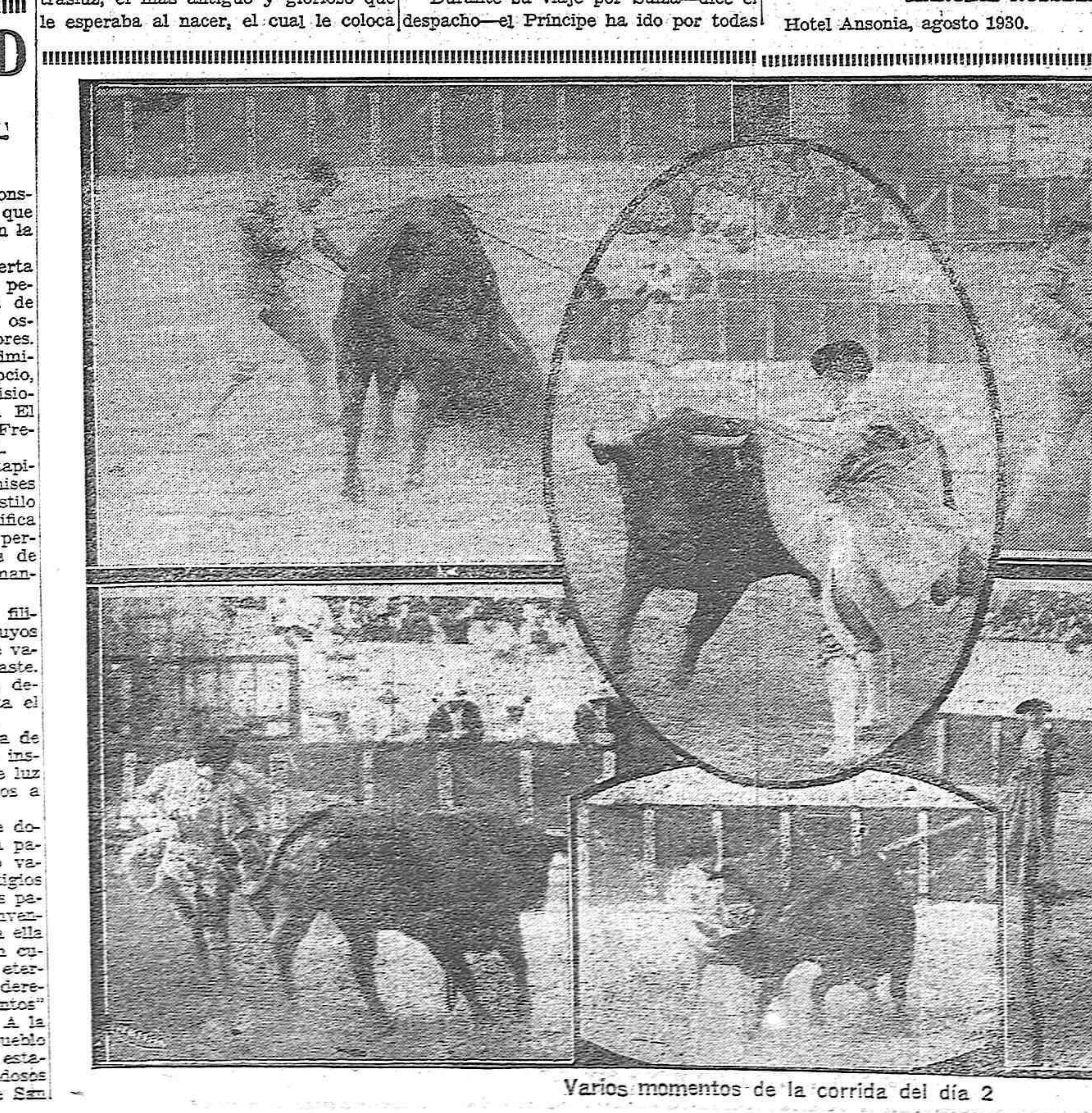
Varios momentos de la corrida del día 2