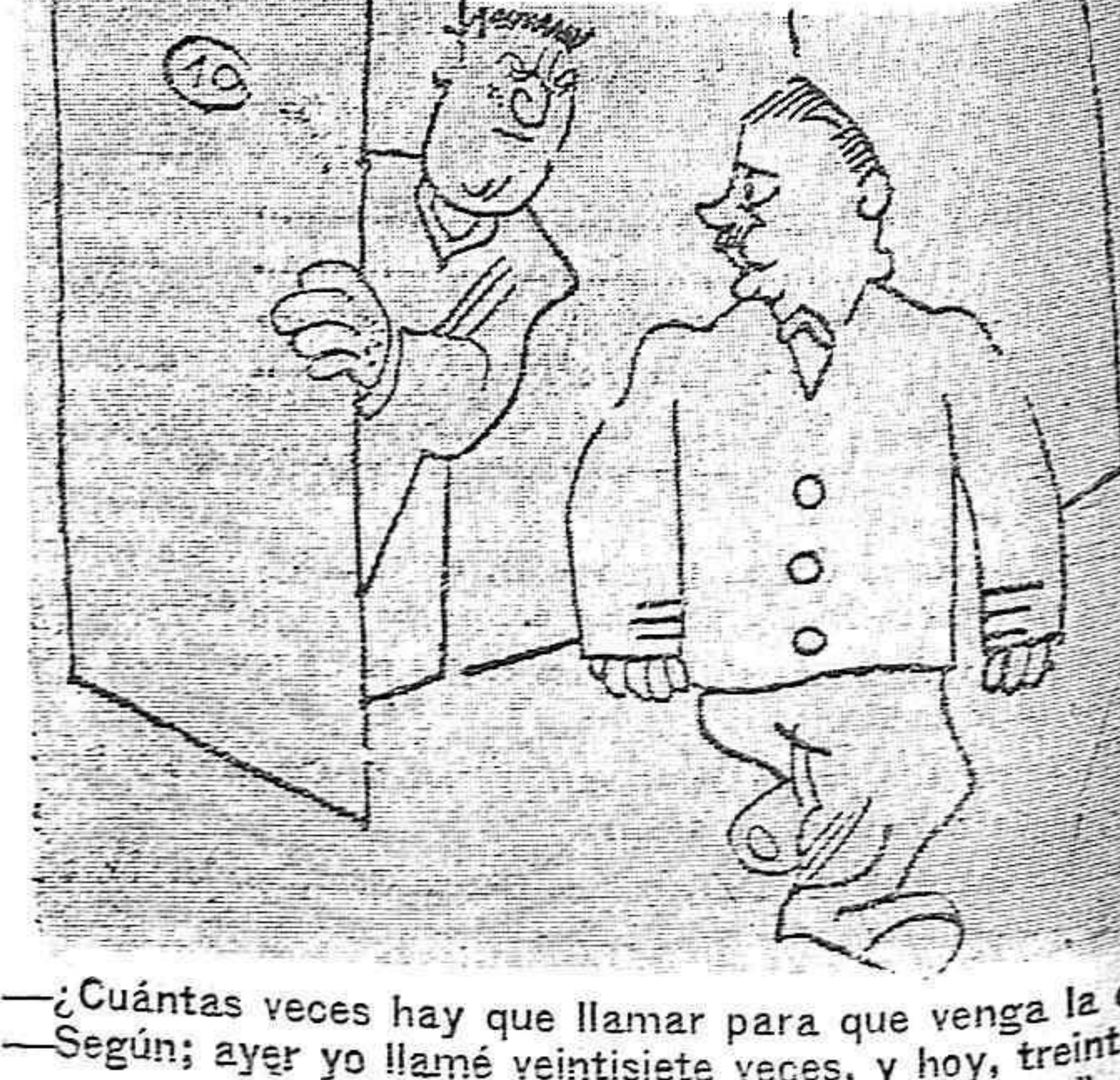
—¿Cuántas veces hay que llamar para que venga la cama...? Según, ayer yo llamé veintiseis veces, y hoy, treinta y...