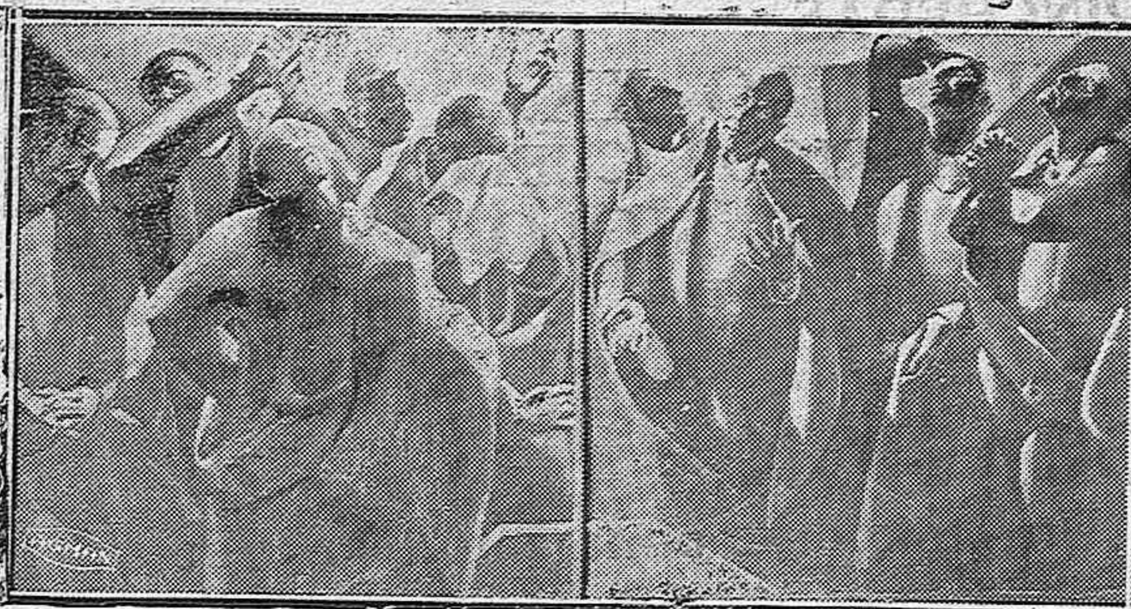
PARA LA IGLESIA DE VILLADA.—Otro estudio para la misma composición mural.

Parece ser que esta retirada en bloque ha sido ordenada por el Gobierno ruso para evitar que prosigan las agresiones de los últimos días.