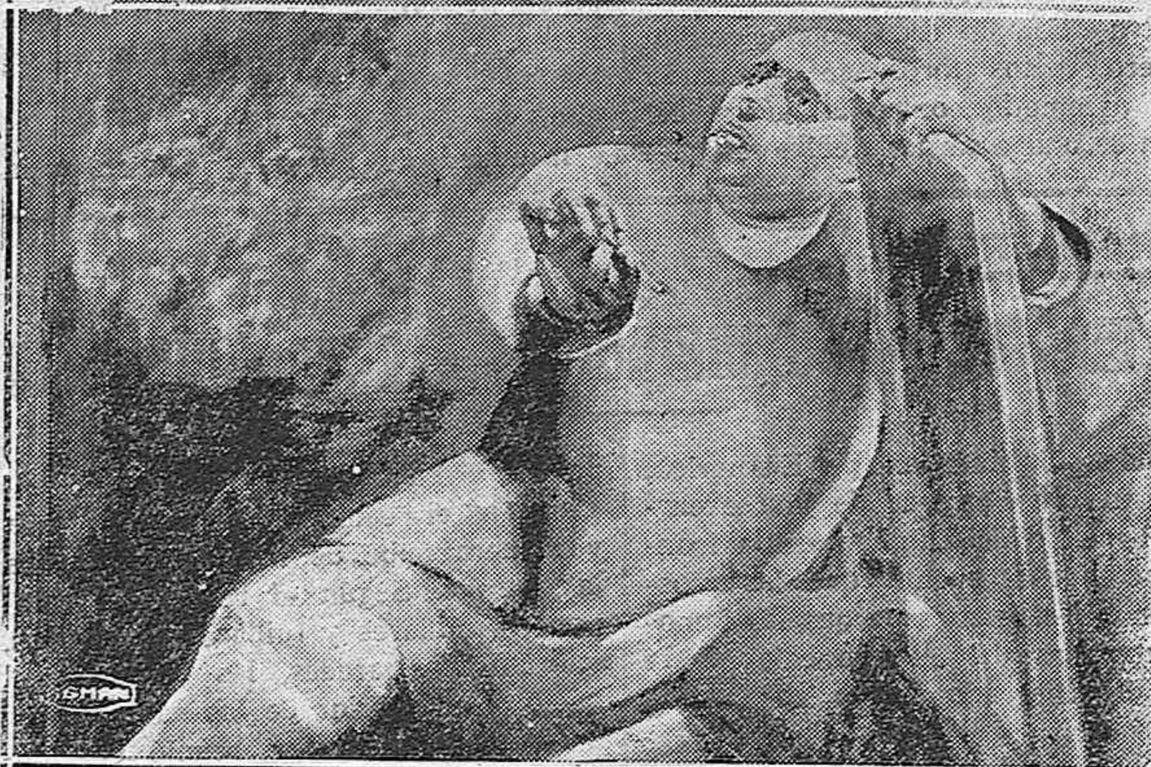
PARA LA IGLESIA DE VILLADA.—Fragmento de boceto para un fresco, obra del ilustre pintor Cosío. Representará este fresco la Ascensión, y de la historia del mismo hemos hablado ya a nuestros lectores.