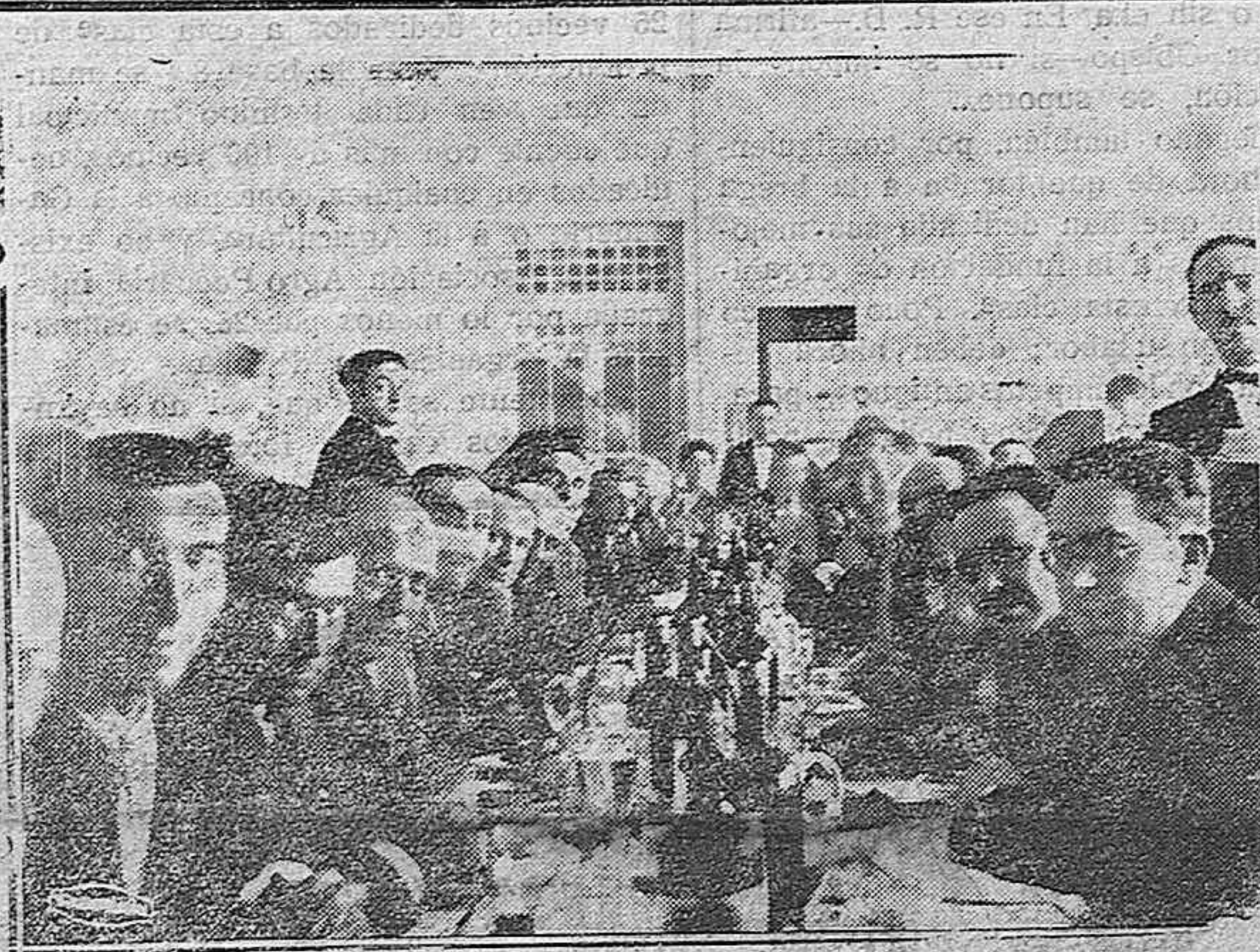
Asistentes al banquete organizado por la Federación en el Hotel Samaria.

cada instante, por desgracia. El que penetre un ladrón en una casa cualquiera y se lleve unos ochavos, es un hecho también de cada día, pero se llenaría la nación de ladrones de esta