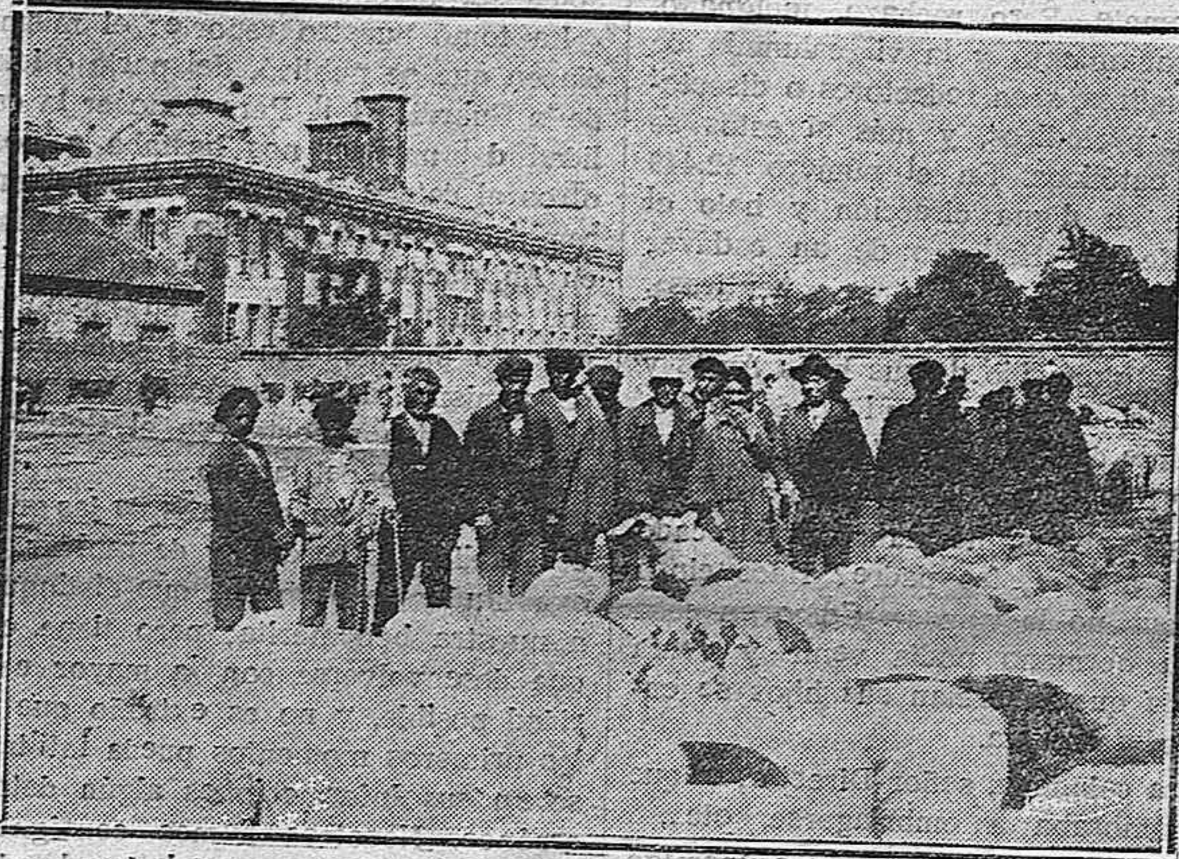
Un grupo de feriantes tratan de comprar reses lanares.

«El Heraldo de Madrid» ya debiera entender a estas alturas que un periódico católico no es el Concilio de Trento.