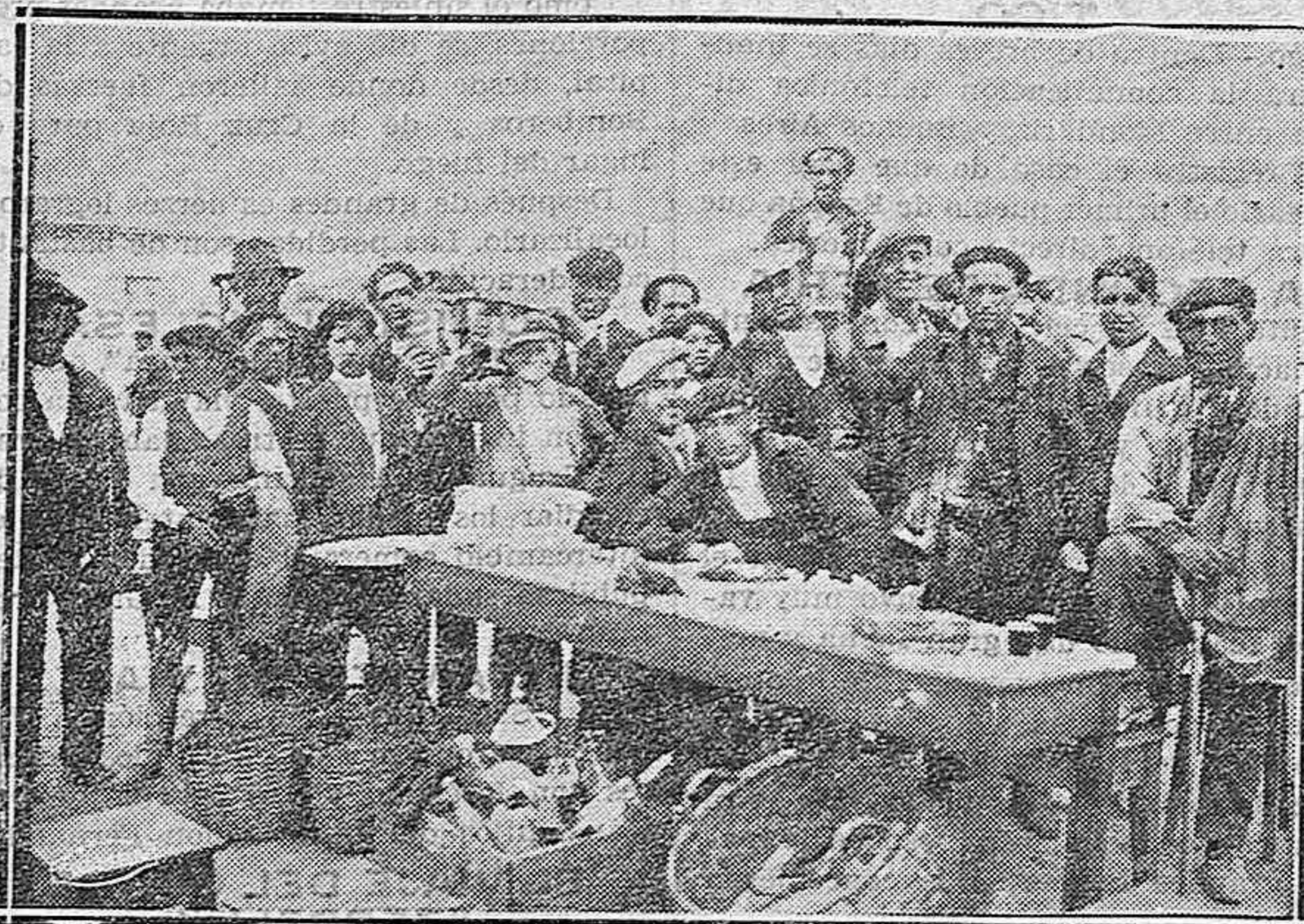
Una cantina al aire libre para los feriantes.

Vigo.—Procedentes de Oporto han llegado seiscientos turistas en un tren especial. En automóviles llegaron otros doscientos más. Permanecerán aquí tres días, habiéndose organizado varios actos en su honor.