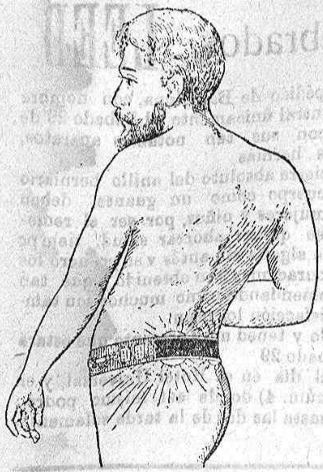
Marca registrada. Núm. 28.457

¿Sufrís enfermedades nerviosas? ¿Dolores reumáticos, de espalda y de riñones? ¿Tenéis desarreglos del estómago, del hígado y de los intestinos? ¿Adelgazáis? ¿Se os debilita la memoria? ¿Encontráis dificultad en conciliar el sueño y os levantáis más fatigados que cuando os acostáis? ¿Sufrís parálisis o debilidad genitales? ¿Os encontráis agotados de fuerza intelectual o corporal? Si sufrís alguna de estas enfermedades, habiendo probado los mejores específicos conocidos sin ningún resultado, no os desesperéis, que vuestro infalible e inofensivo remedio lo encontraréis en la naturaleza, usando sin vacilar el maravilloso