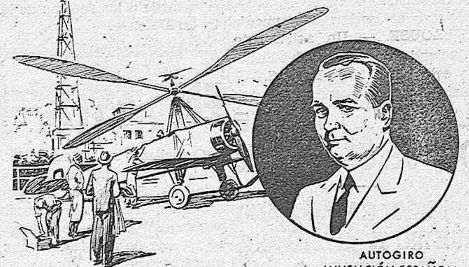
AUTOGIRO INVENCIÓN ESPAÑOLA JUAN DE LA CIERVA 1895-1936

Todos los grandes inventos son fruto de ideas luminosas. Existen en el universo materias y energías, que utilizadas con el acierto de una feliz idea producen efectos asombrosos. He aquí el secreto de la INSTANTINA, combinación especial de eficacísimos elementos terapéuticos, inocuos y seguros, que cortan con la máxima rapidez los resfriados y sus consecuencias así como toda clase de dolores.