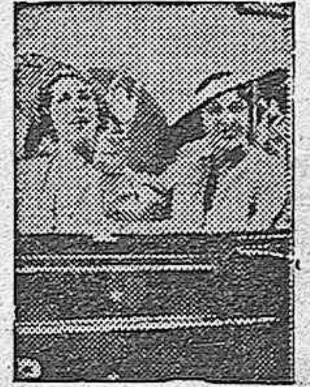
Lady Chamberlain y lady Halifax son íntimas amigas. Fieles esposas, suelen acompañar a sus maridos, y debido a esto han sido testigos de verdaderos momentos históricos.