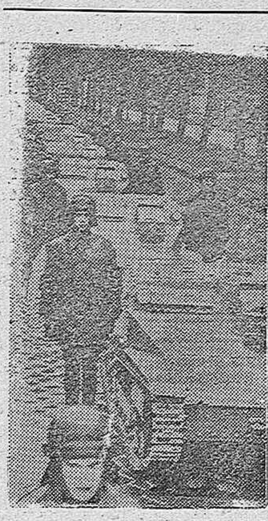
MANIFESTACION MILITAR EN VIENA. PARADA DE UNA COLUMNA DE TANQUES