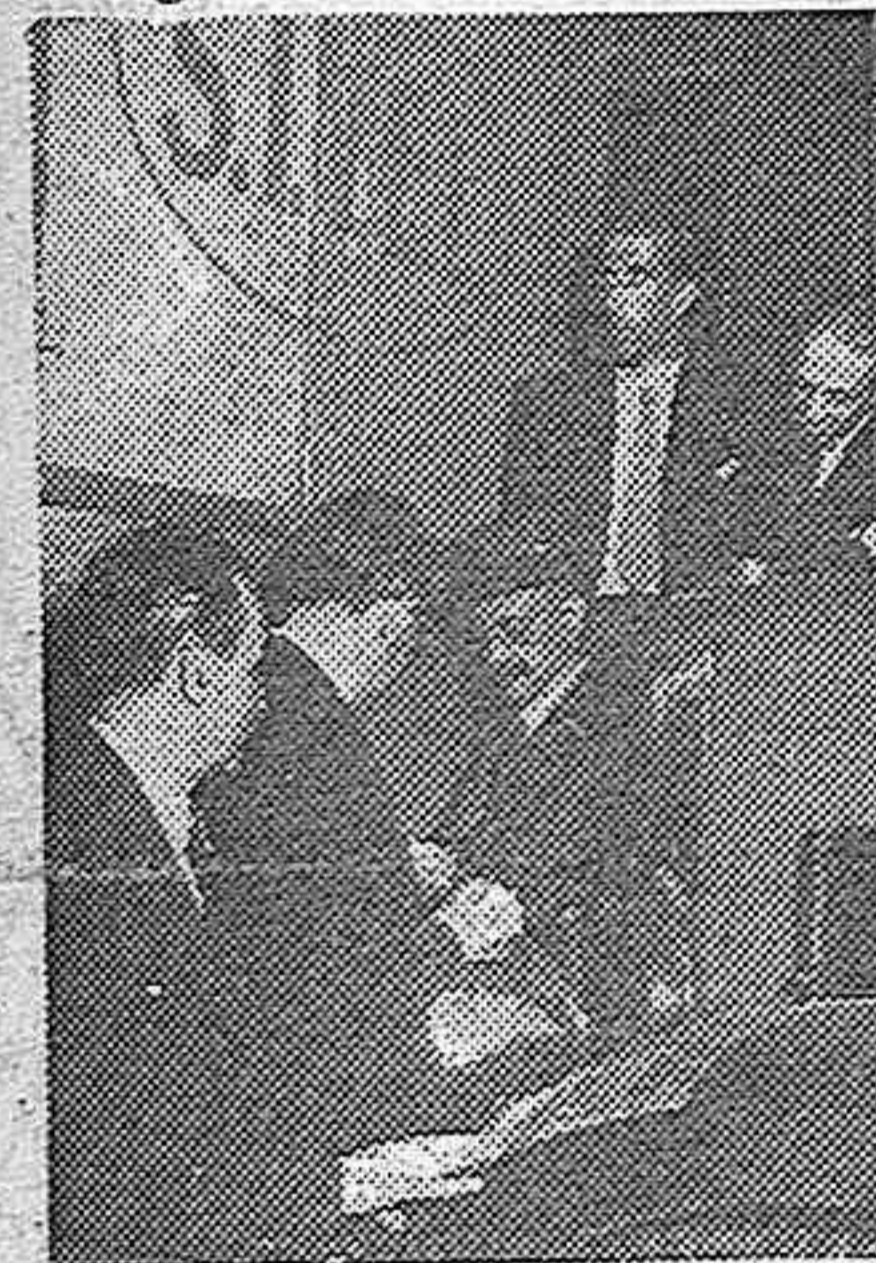
El cajero del Banco de España quitando los precintos de uno de los camiones.