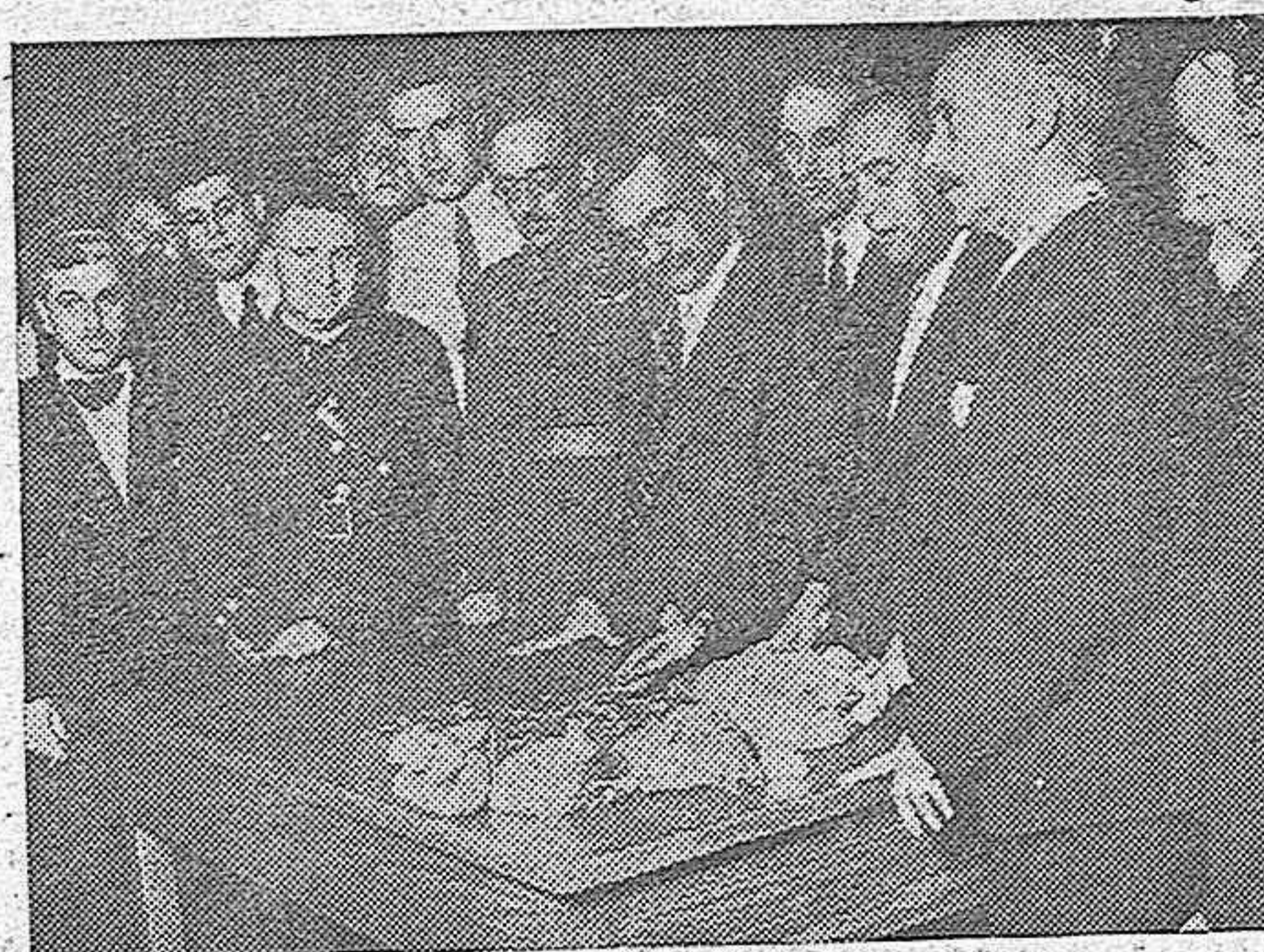
Representantes del Banco de España que se hicieron cargo en Francia del oro español.