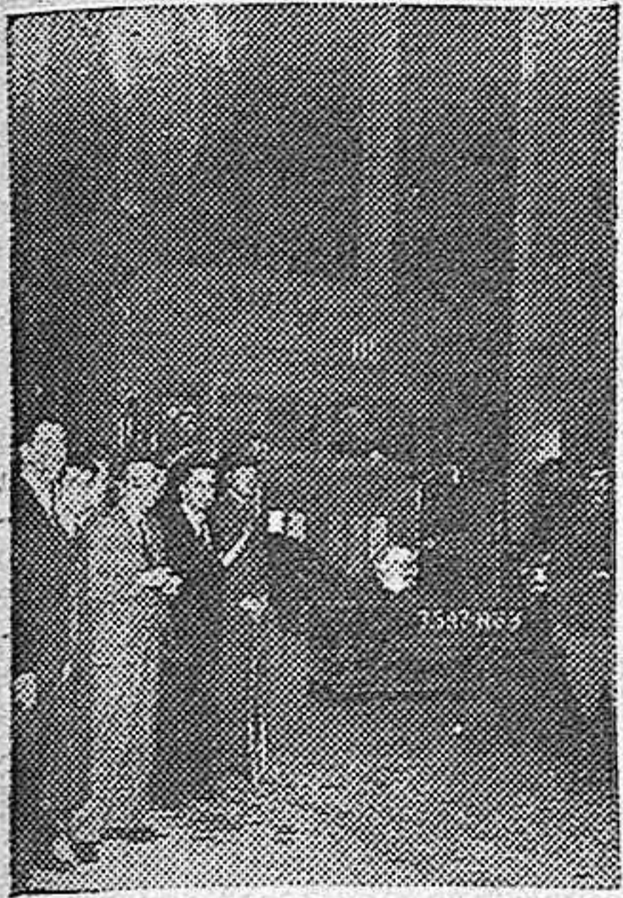
El primer camión que, procedente de la frontera francesa, entró con su preciosa carga en el Banco de España.