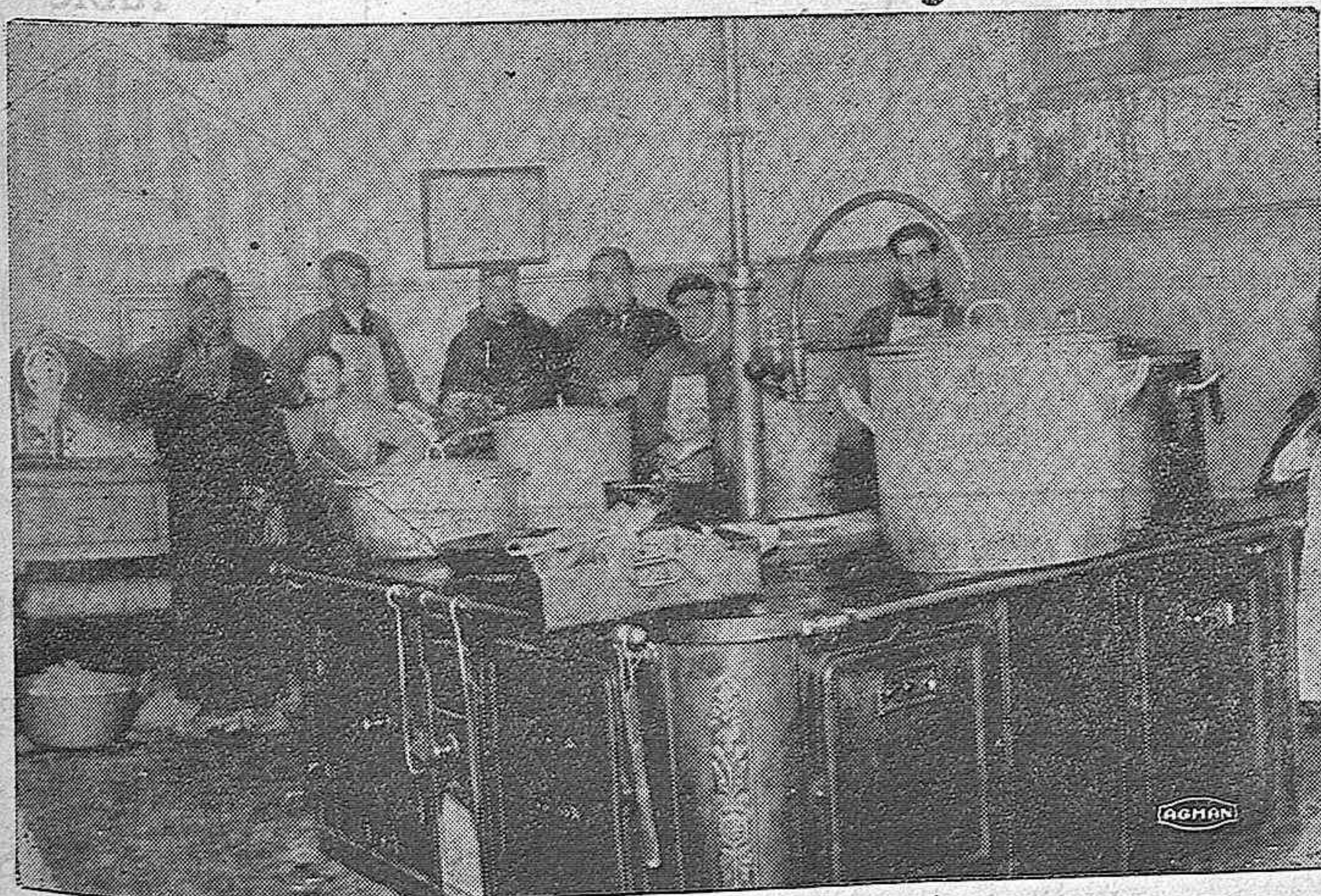
Cocina del Manicomio

Autorizado por la Inspección Mercantil y de Seguros