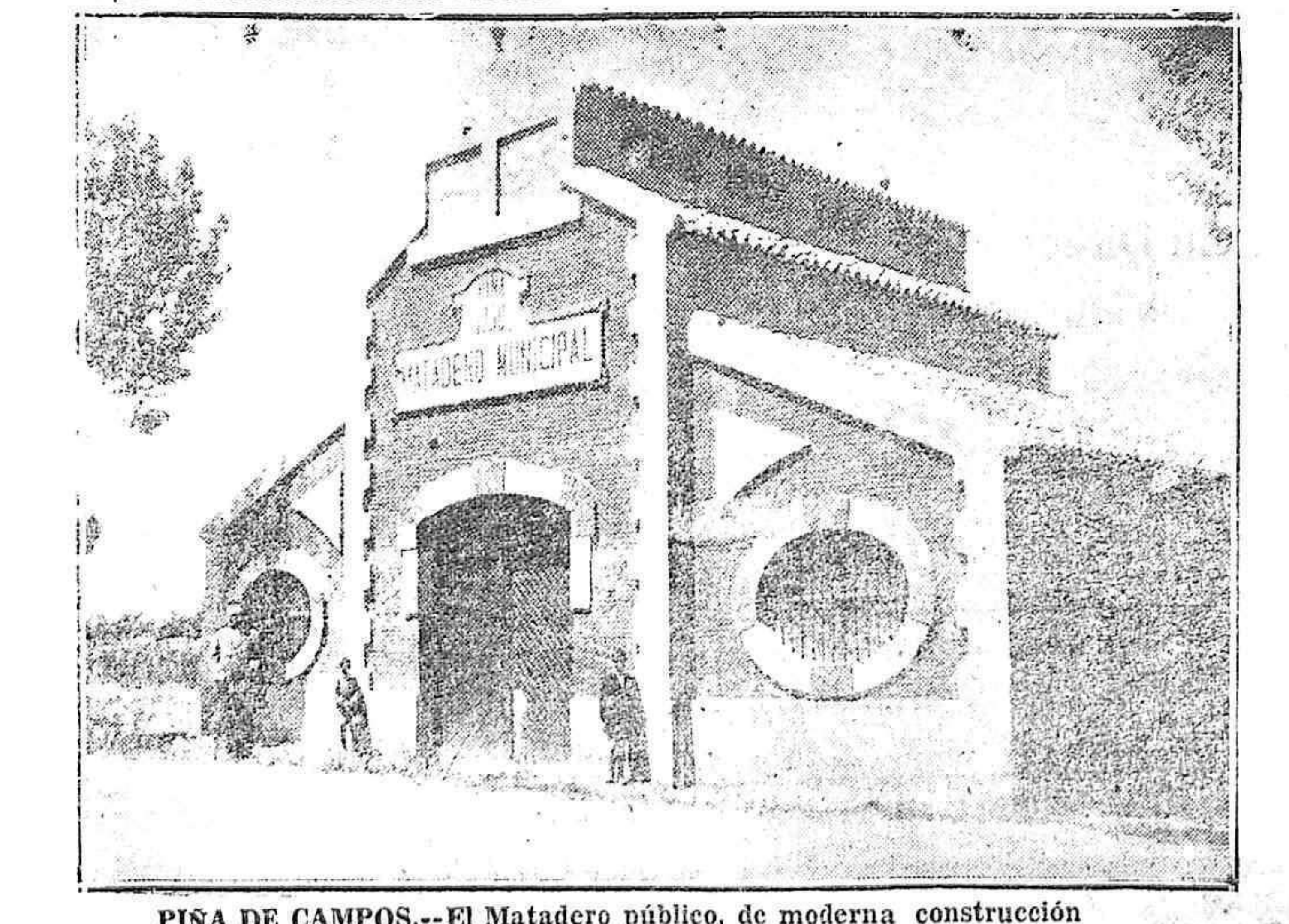
PIÑA DE CAMPOS.—El Matadero público, de moderna construcción