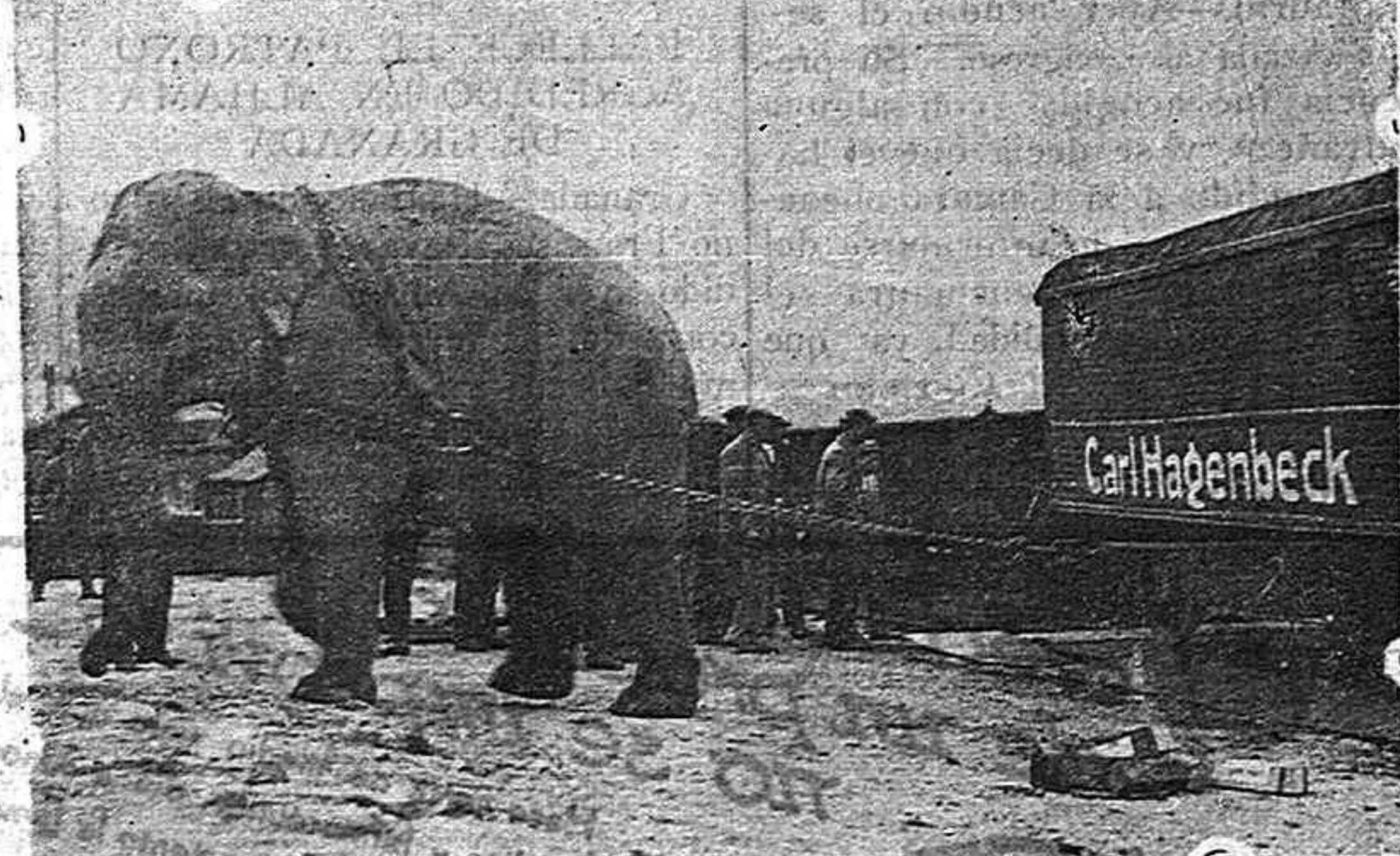
Uno de los elefantes trabajadores del famoso Circo CARL HAGENBECH, que llegará a Palencia para empezar su actuación durante tres días

El circo es el espectáculo que mejor nos retrotrae a los días de nuestra infancia. Más que en parte alguna, es alrededor de la pista de un circo donde vemos a los hombres despojados de su gravedad o de sus pesares para entregarse a la sana alegría que le acerca al niño. Y es que el circo es el espectáculo puro por excelencia. En él los trucos no son disimulados. Por el contrario, su valor consiste en la caricatura y exageraciones que de ellos hace, para obtener el contraste con la realidad, contraste que nos obliga a reír por el realce que da a cosas que nosotros apreciamos u odiamos. En cuanto al otro aspecto del circo, su aspecto más puro, más natural, en que nos presenta al hombre cara a cara con el animal de la selva o el simple animal que de siglos viene siendo el compañero del hombre. En este aspecto no necesita ni de maquillajes, ni de trucos de ninguna especie.