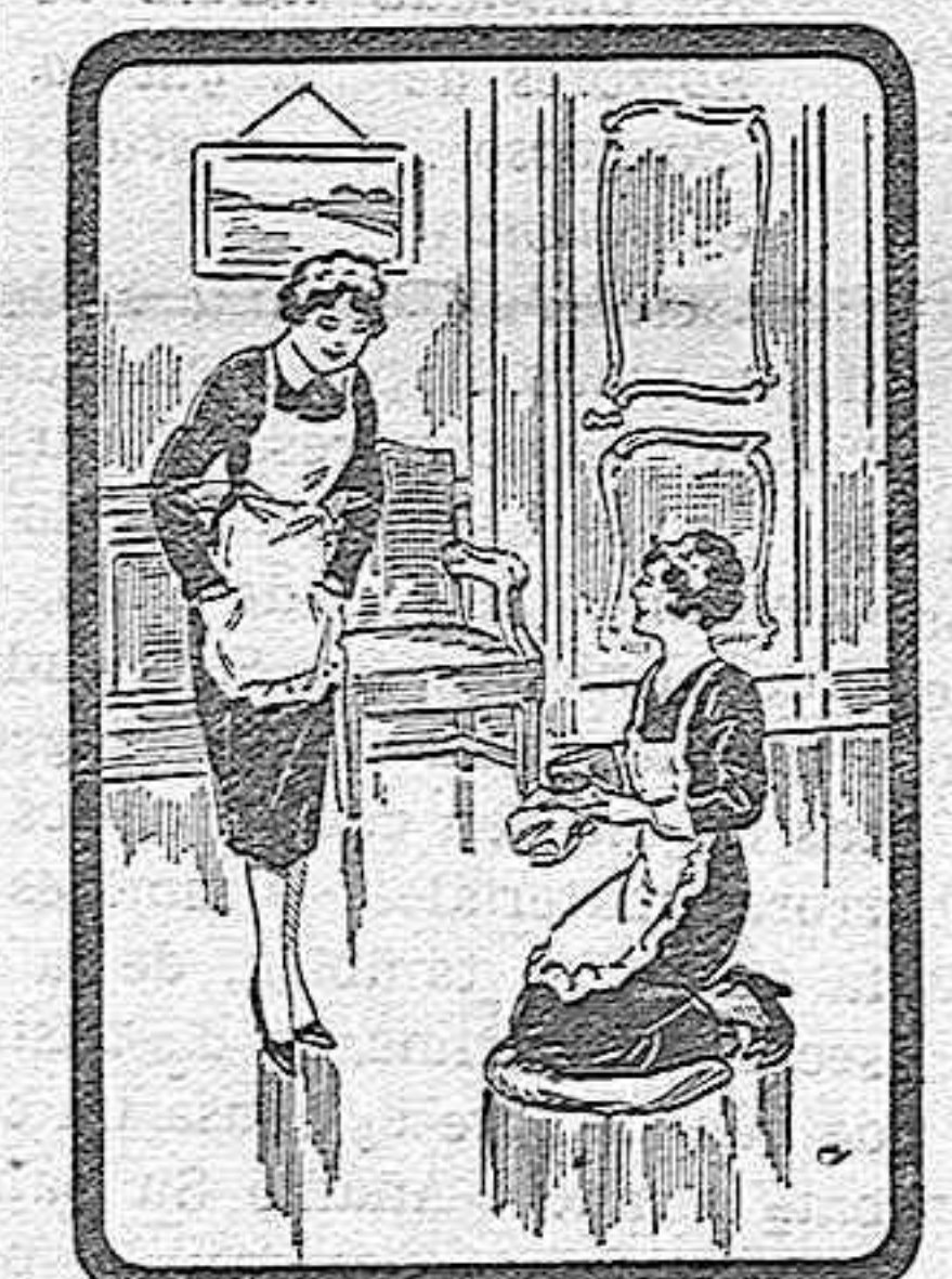
DA GUSTO VERLAS —¡Sí, mujer, eres muy guapa! —¡Pero si no me miro! Es que me entusiasma lo limpio que deja el suelo el "ENCAUSTICO ALIRON". ¡Queda como un espejo!

Un nombre que debe usted grabar en su memoria: TINTORERIA ALEMANA Tíñe y limpia por los más modernos procedimientos.