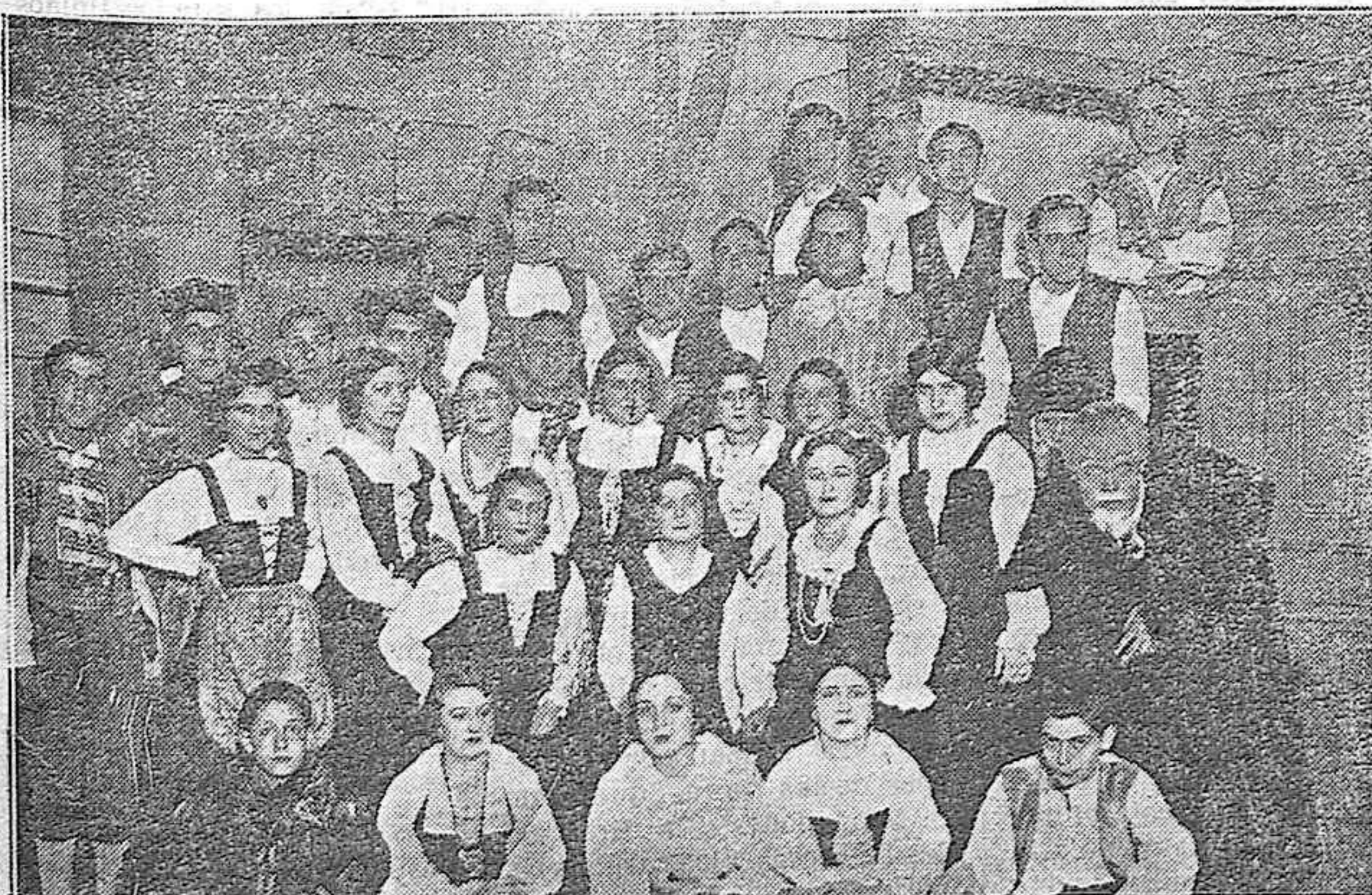
"EL VILLANO SEÑOR".--Simpático grupo de jóvenes palentinos que tomaron parte en el estreno de esta magnífica zarzuela.