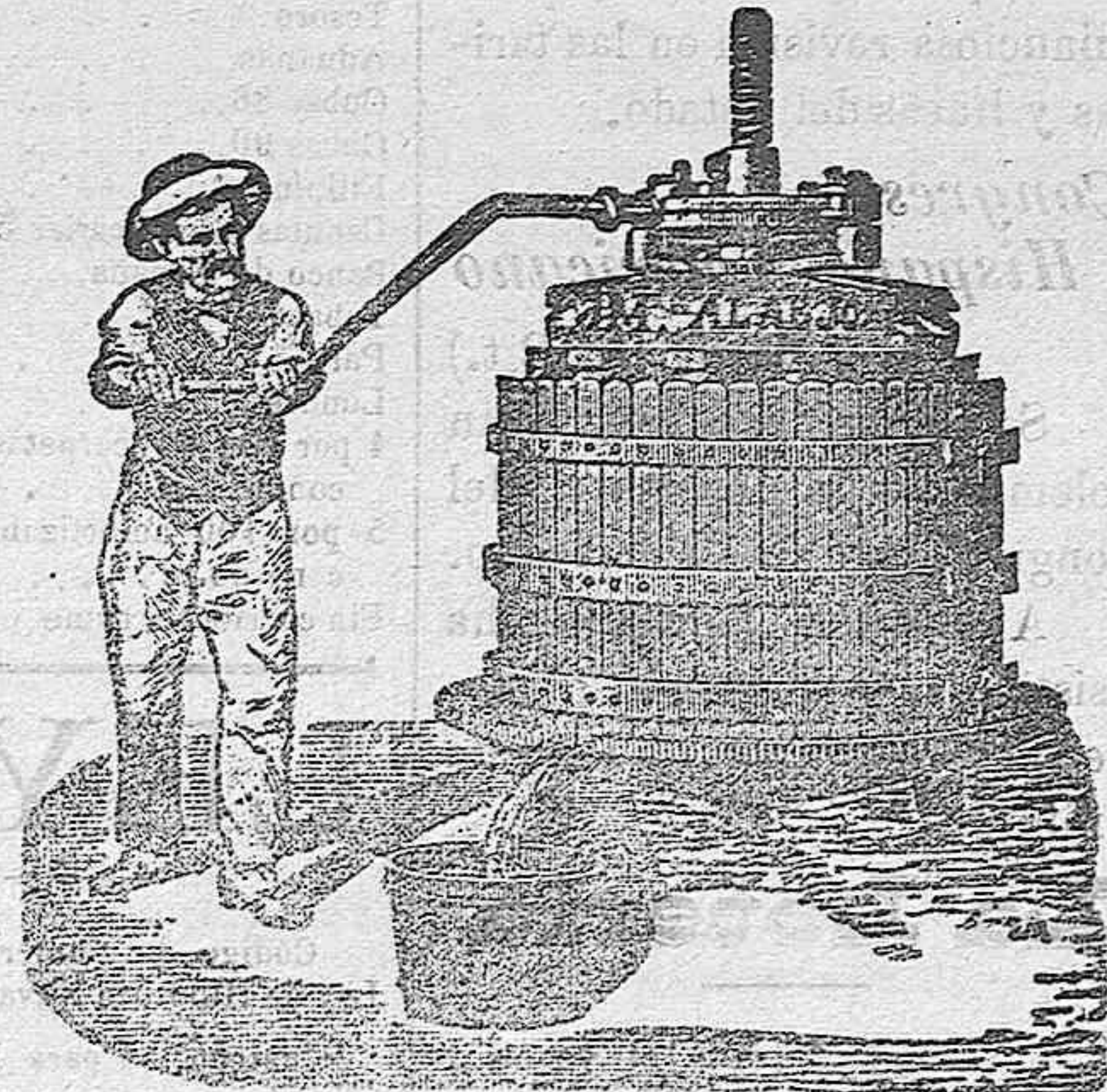
PRESA DE UVA