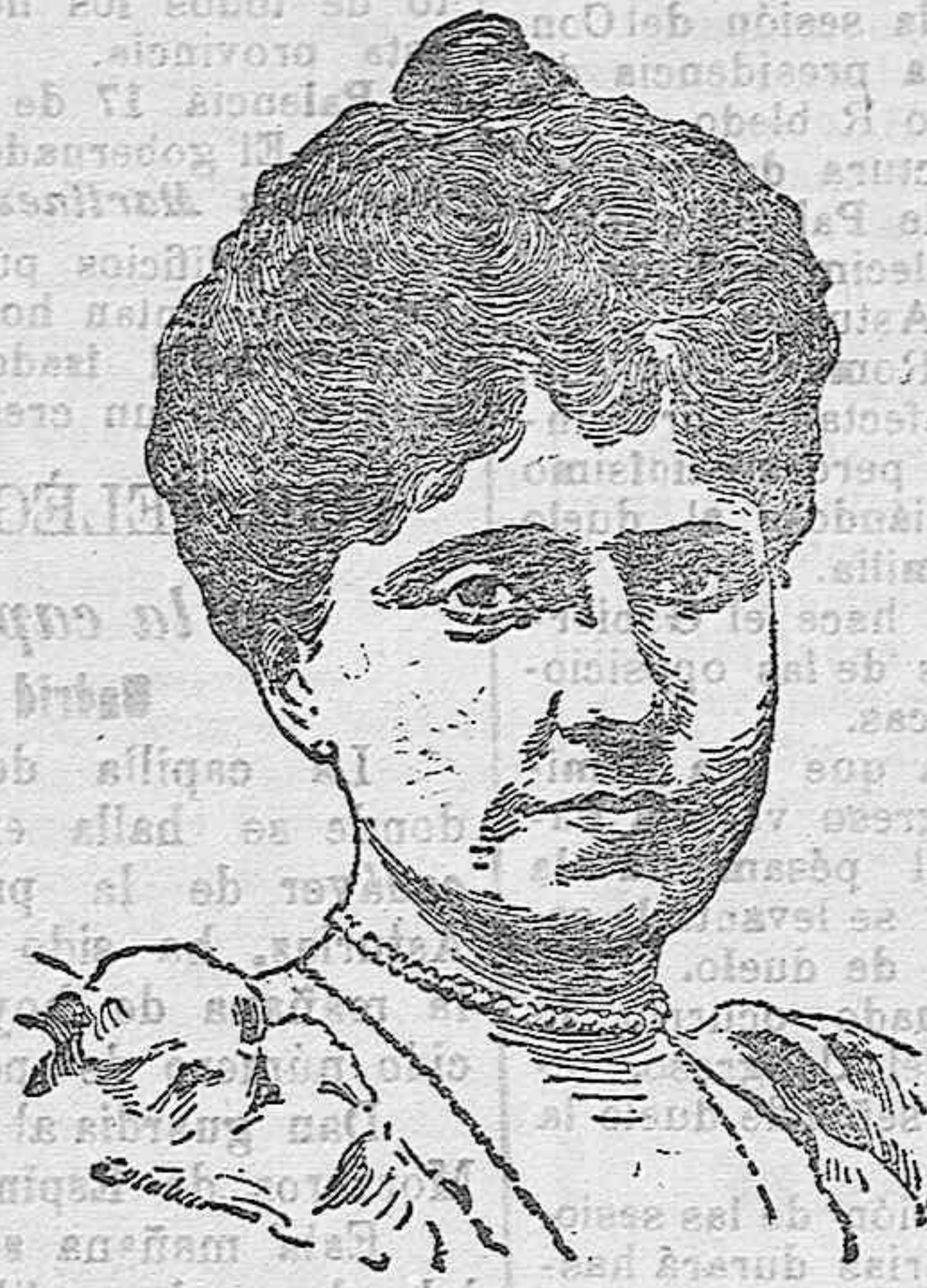
La Princesa de Asturias

A las cinco de la tarde de ayer llegó á nuestra redacción el telegrama urgente, inserto en el número anterior, dándonos cuenta del fallecimiento de S. A. R. la Princesa de Asturias.