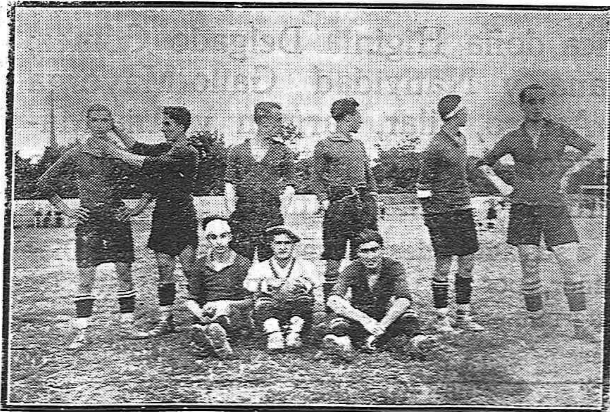
DEL PARTIDO DE AYER. — Selección Vallisolerana que resultó vencida por nuestro equipo