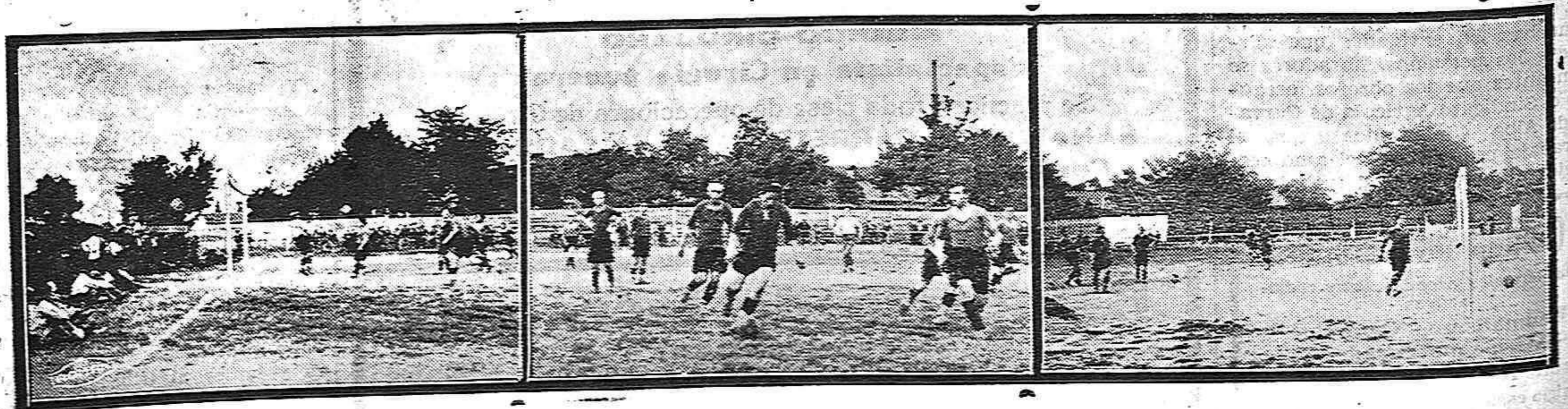
Uno de los goles marcados por nuestro equipo