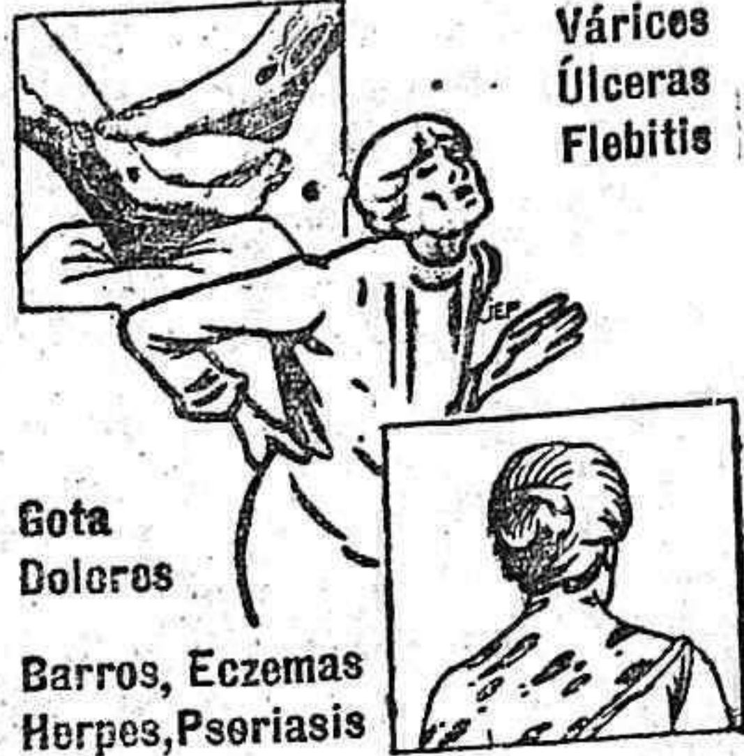
Várices Úlceras Flebitis

Gota Dolores Barros, Eczemas Herpes, Psoriasis