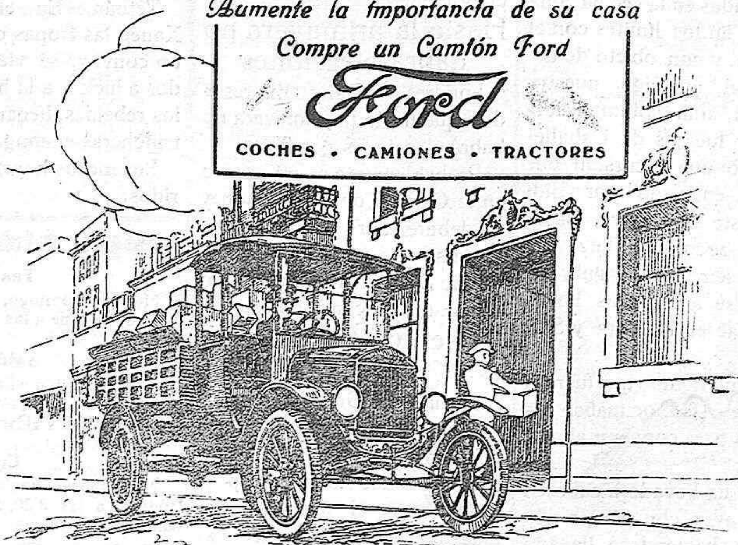
PUEDA SUMINISTRARSE CUALQUIER TIPO DE CARROCERIA.

Unicos agentes oficiales FORD en Palencia: MARTIN Y C.ª