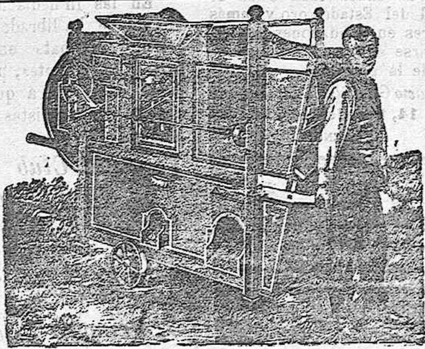
Jorge Martín e Hijos

Maquinaria y accesorios para la industria. Cálculos y presupuestos a quien los solicite Valladolid, Avenida de Alfonso XIII, 8 y 9