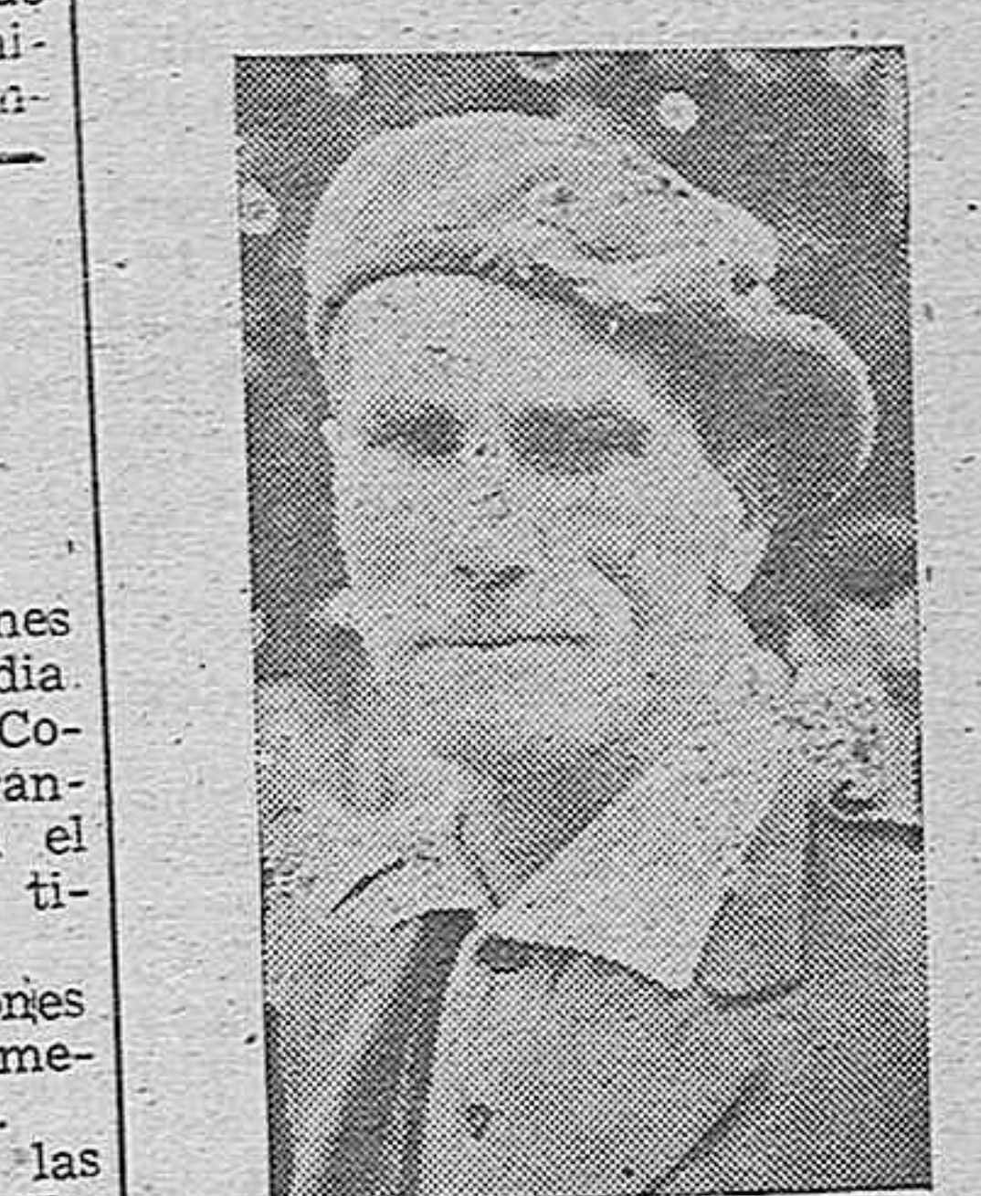
Por su brillante actuación en las campañas del Norte y posteriormente como gobernador militar de Asturias, al producirse el derrumbamiento de aquel frente, ha sido concedida tan preciosa distinción por el Caudillo, al coronel de Artillería habilitado para general, don Rafael Latorre Roca.