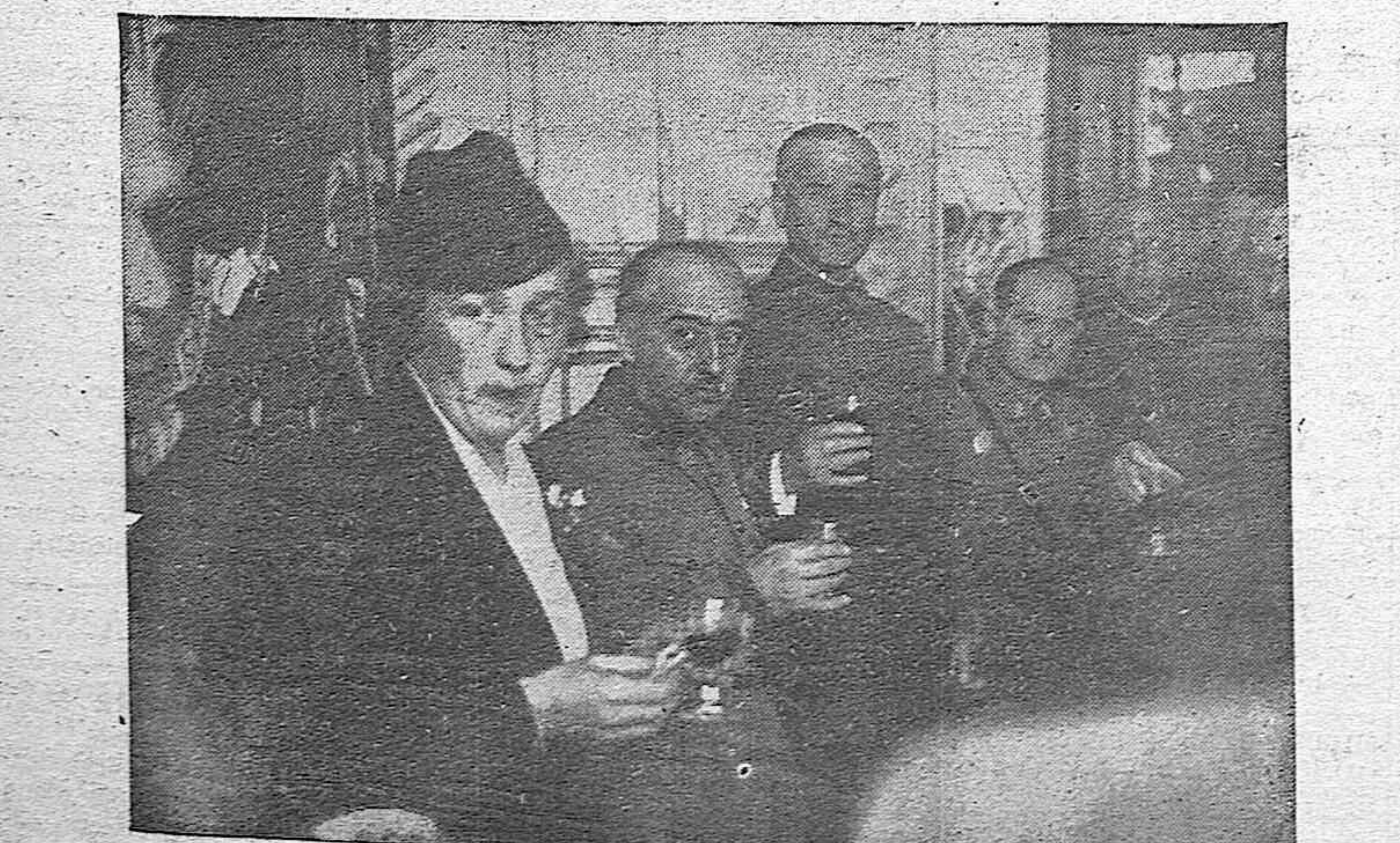
SEVILLA.—El Generalísimo Franco, acompañado del general del Ejército del Sur, general Queipo de Llano, y otras autoridades, durante el vino de honor ofrecido a S. E. en su residencia del palacio de Yanduri.

Después de curado de primera intención, se le trasladó al hospital provincial en una camilla de la Cruz Roja.