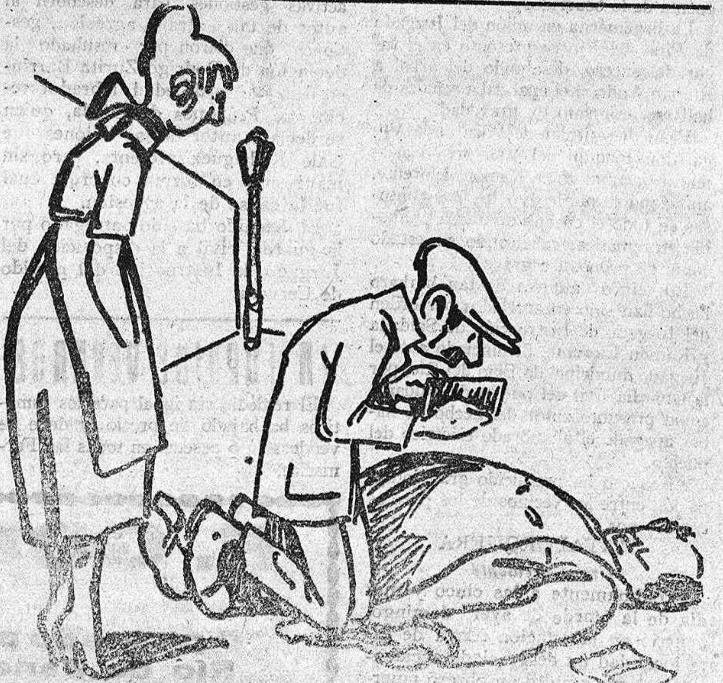
DESPUES DEL ASESINATO La cómplice.—¿Qué dice en ese papel que hay en la cartera? El asesino.—Que se marchaba al río con propósito de suicidarse por falta de recursos.