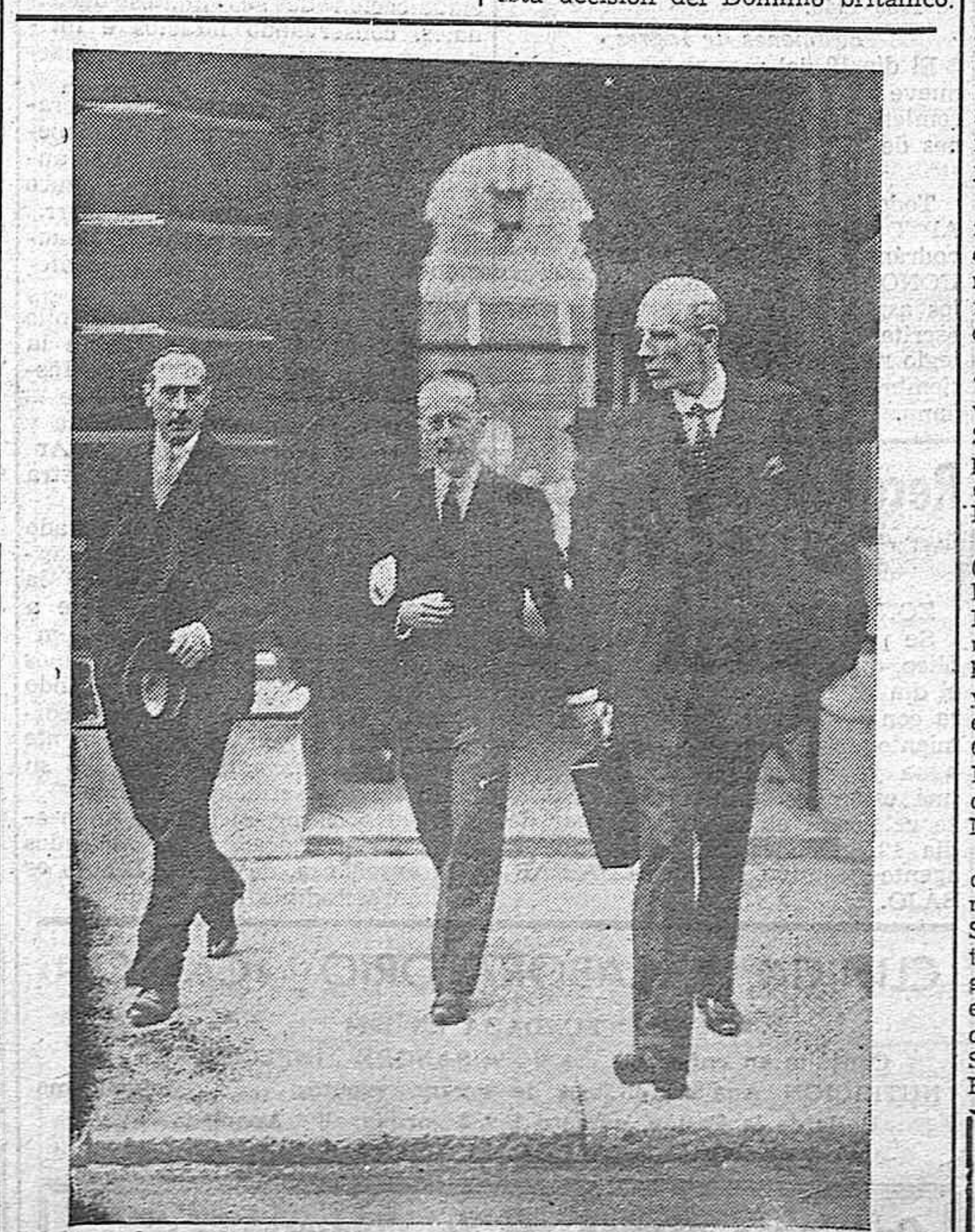
LONDRES.—El embajador de Inglaterra en Berlín, sir Neville Henderson, saliendo del Foreign Office acompañado de los ministros británicos sir A. Coadogan (en el centro) y Lord Halifax (a la derecha), a quienes dió cuenta de las negociaciones realizadas con el Gobierno alemán.

Londres, 11 (3 t).—El Almirantazgo publica un comunicado oficial declarando que en la primera semana de guerra terminada ayer, no han dejado de navegar los buques de guerra, así como los mercaderes que enarbolan bandera británica. No se ha registrado ninguna acción de guerra importante. Destaca el parte los servicios realizados para mantener las comunicaciones marítimas y los efectuados por las unidades de pequeño porte en persecución de los submarinos alemanes. INGLATERRA PREPARADA PARA TRES AÑOS DE GUERRA, ALEMANIA PARA LOS QUE FUERE PRECISO Berlín, 11 (3 t).—Comentando la declaración inglesa de que Gran