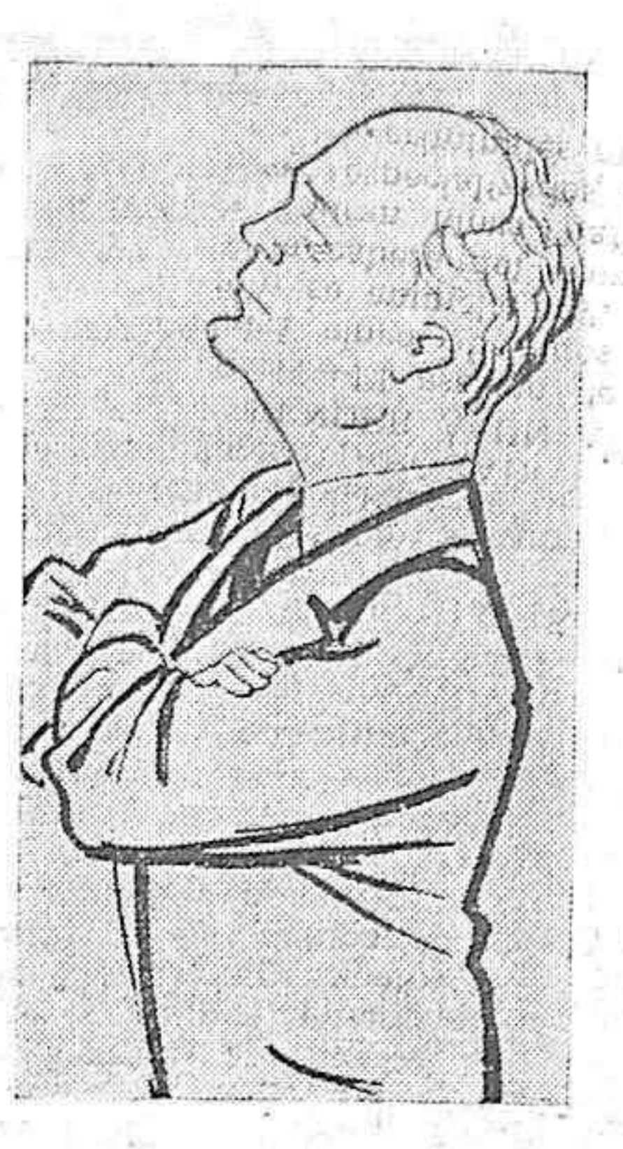
VON RIBBENTROPP ministro del Reich, que llegará el lunes a París, para firmar el pacto franco-alemán.