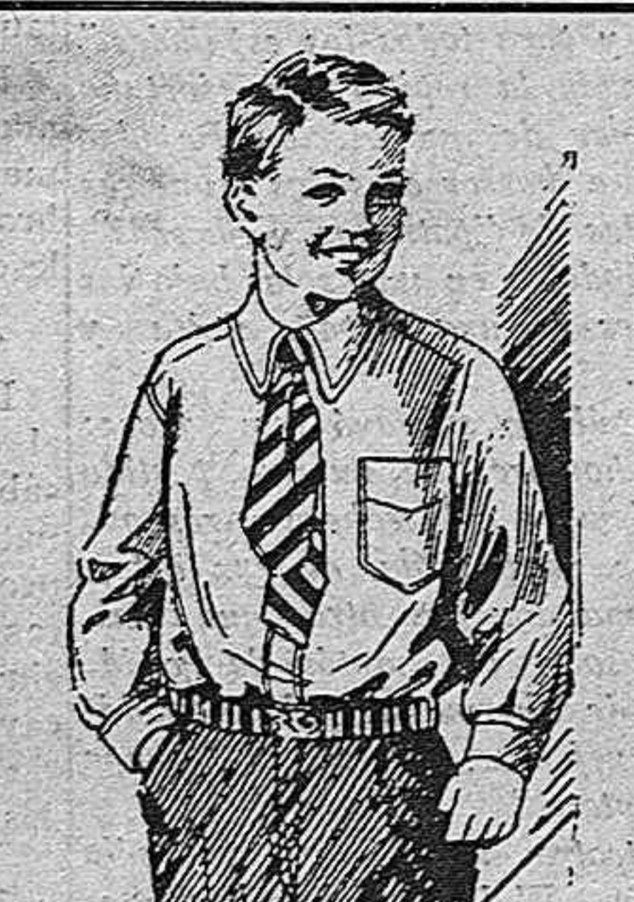
Obséquienle a su hijo Su precio lo permite ¡Qué bonitos juegos de pantalón y camisas presenta siempre

A las once de la mañana y con asistencia de las autoridades civiles y militares de la población, prometieron la bandera ayer, en el patio principal del Cuartel del Batallón Ciclista, los nuevos reclutas pertenecientes al segundo llamamiento del reemplazo de