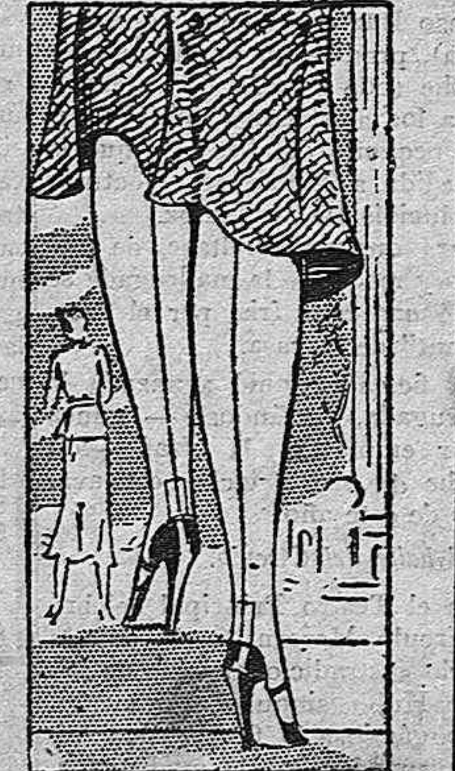
¿Unas bien perfiladas pantorrillas? Han de ser las medias de

El Ayuntamiento de Redondo interesa una gratificación por el puente que acaba de construir en Santa María.