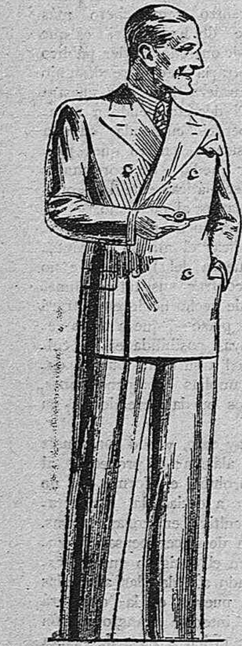
REGIOS TRAJES CONFECCIONADOS