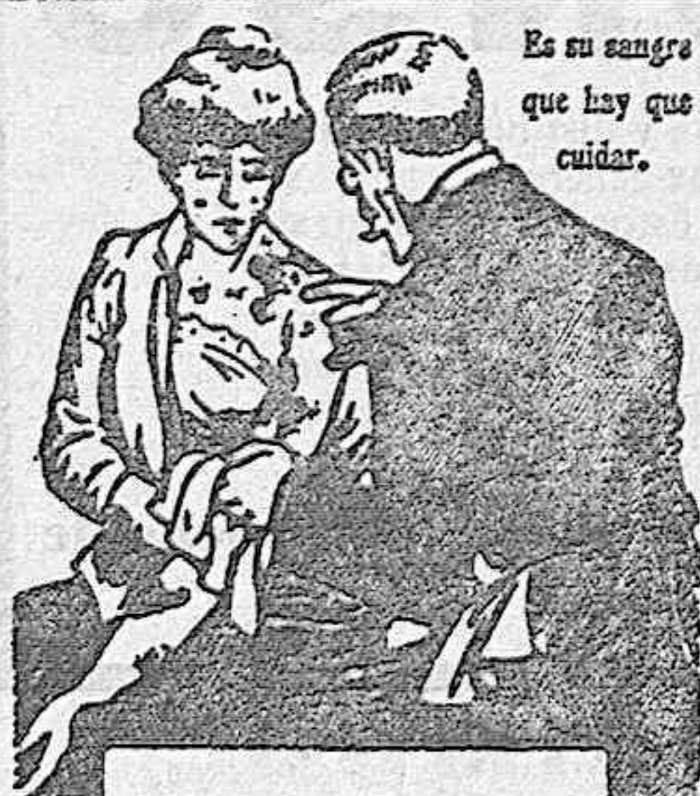
Es su sangre que hay que cuidar.

GRAN OCASIÓN. Tabla de chocho castellano de ocho pies, de ocho a doce pulgadas ancho, por 1 y 1/4 grueso y siete pies y una pulgada. Alfingia de las mismas dimensiones, largo de 4 X 3 pies y de 11 pies largo de 4 y 1/4 X 3; para tratar en Ampudia, con Florencio Valverde.