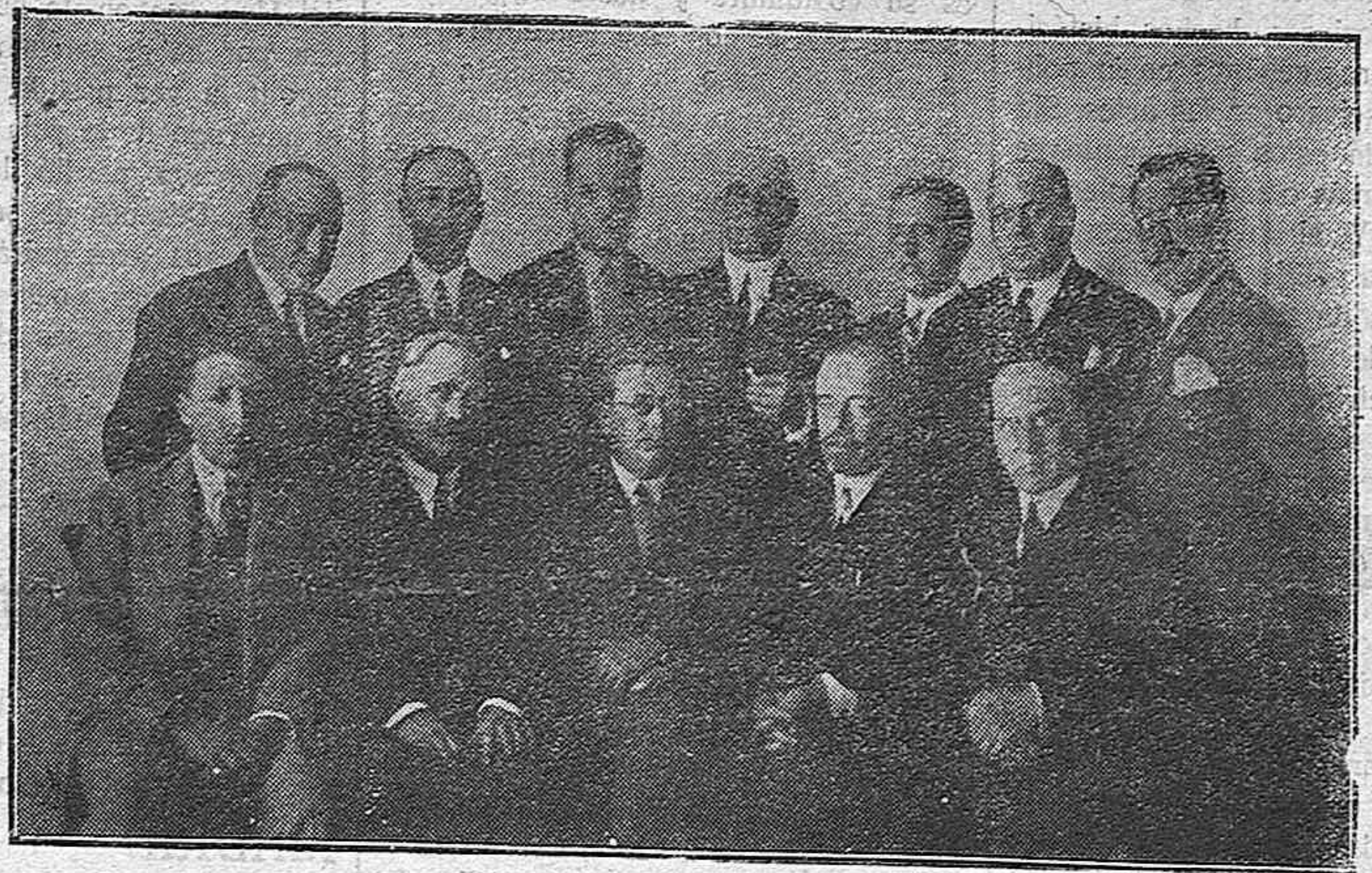
LA COMISIÓN ORGANIZADORA DE LA C. H. DEL DUERO

Uno de los aspectos de beneficio que considero más importantes, es el que vamos a tener en nuestras manos la posibilidad de aplicar la moto-