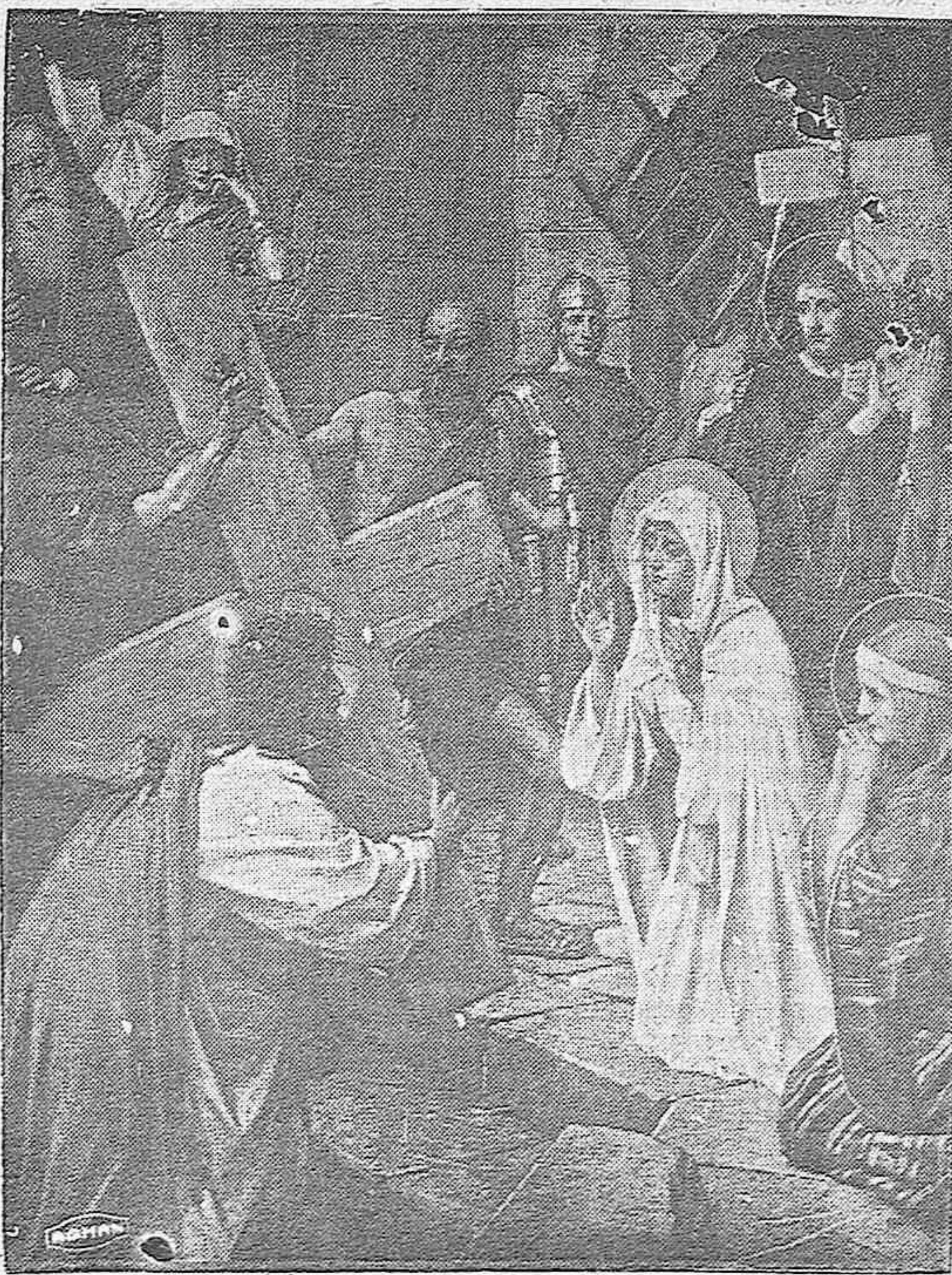
Jesucristo es llevado al camino de la amargura por el camino del Calvario, entregado al dolor, realizando el supremo ejemplo que es guía de nuestra fe