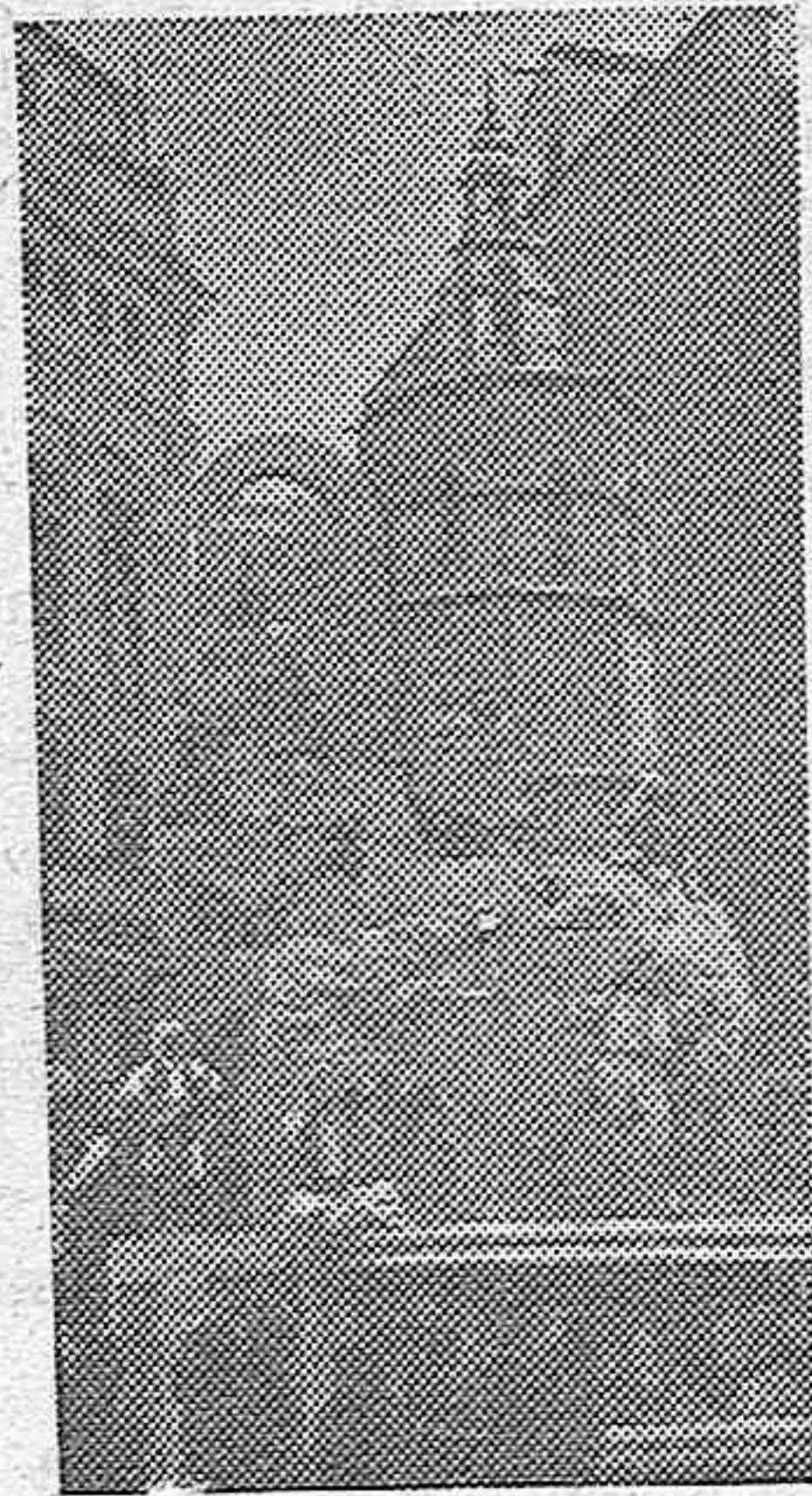
La "foto" recoge una de las fallas que el pasado domingo fueron quemadas en Valencia. Esta se hallaba situada en la plaza de Lope de Vega y ha sido premiada con 1.500 pesetas.

PARIS, 20.—Según los círculos políticos bien informados, Paul Reynaud tratará de formar un Gobierno de unión nacional, en el que estén representados todos los partidos del país, desde la extrema izquierda de León Blum hasta la extrema derecha de Luis Marin.