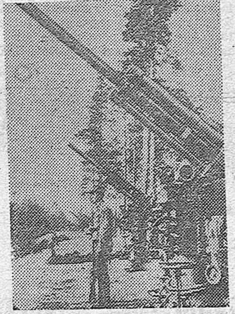
Colocada en el borde del bosque, esta batería antiaérea finlandesa protege posiciones importantes de la línea Mannerheim.