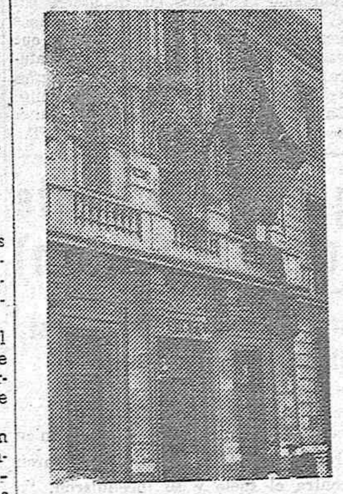
Después de tres años de cierre ha abierto sus puertas a la contratación mobiliaria la Bolsa de la capital vizcaína, cuya fachada principal recoge el grabado.