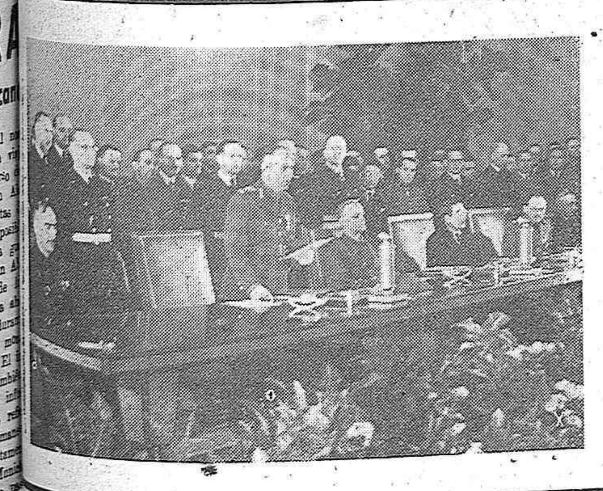
El jefe de Estado rumano, general Antonescu, a quien ve la fotografía leyendo la declaración de su Gobierno, se ha reunido en la nueva Cancillería del Reich la solemnidad de la adhesión de Rumania al pacto germano-italo-japonés